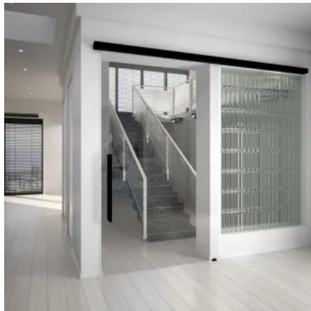
MUTO Premium Self-Closing 120

Aus der Serie Drehtür- und Schiebetürbeschläge von DORMA-Glas