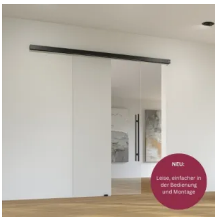
Schiebetürbeschlag MUTO Comfort M 60 2.0

Für kleine Türen und große Gestaltungsfreiheit - schon ab 600 mm Flügelbreite. Der Schiebetürbeschlag MUTO Comfort M 60 2.0 ist perfekt für den Einsatz in Apartments, Hotels und Gastronomie. Er verbindet Design mit Nutzerzentrierung: Die einfache Montage und frontseitige Einstellbarkeit vieler Funktionen bieten hohen Komfort. Eingehängte Flügel sind zwischen + 4 mm / - 2 mm in der Höhe justierbar und es gibt einen sicheren Aushebeschutz. DORMOTION ist problemlos nachrüstbar, ganz ohne Glasbearbeitung, am montierten Flügel. Außerdem ist die Einbindung eines festen Seitenteils bei Deckenmontage möglich. Das Komfort-Upgrade für MUTO Comfort M 60 2.0 sorgt für eine geräuscharme Handhabung dank optimierter Rollen. Es bedarf dadurch sehr wenig Kraftaufwand. Neue und eindrehbare Halteeinsätze für das Deckblech ermöglichen jetzt eine schnellere und einfachere Montage.