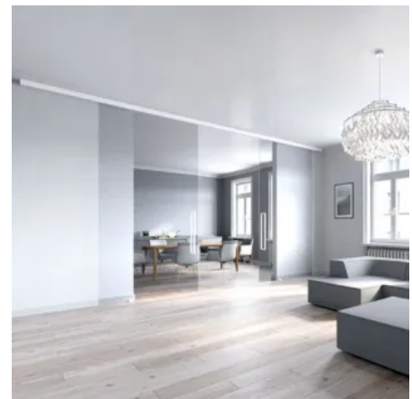
MUTO Premium XL 80 | XL 150

Die Schiebetürbeschläge MUTO PREMIUM XL 80 und XL 150 sind für besonders schwere Türen und/oder besonders breite Flügel geeignet. Damit können sehr hohe Schiebetüren realisiert oder extra breite Durchgänge geschaffen werden. Auch doppelflügelige Ausführungen mit 2 Türflügeln von jeweils bis zu 1.500 mm sind möglich sowie der Einbau von Glas oder Holz-Türflügeln. Außerdem bestehen optionale Funktionen wie Verriegelung mit Statusindikator oder eine Synchro-Version bei Doppelflügeln.