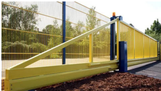
Schiebetor Atlas 2