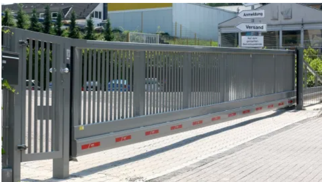
Schiebetor Atlas 1