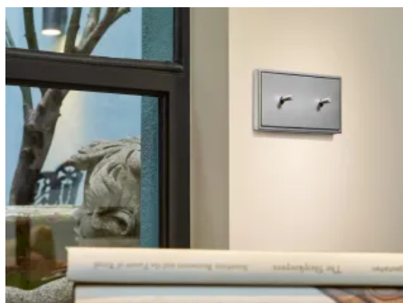
Schalterprogramm LS 1912