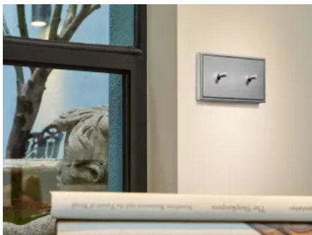
Schalterprogramm LS 1912