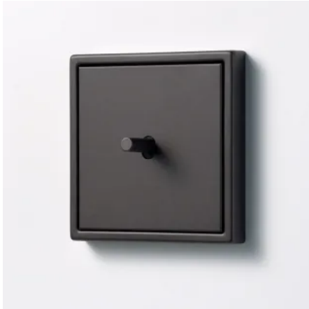
Schalter LS 1912 mit zylindrischem Kipphebel

Kipphebel, Abdeckung und Schaltwerk wurden bei LS 1912 modular entwickelt, sodass bei der Befestigung keine Schrauben sichtbar sind. Nur der Kipphebel erhebt sich als Stilelement aus der Einheit.