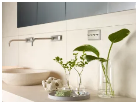
Schalterprogramm LS 1912