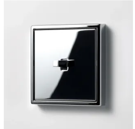
Schalter LS 1912 mit kubischem Kipphebel