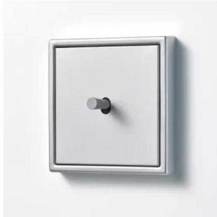
Schalter LS 1912 mit kegelförmigem Kipphebel