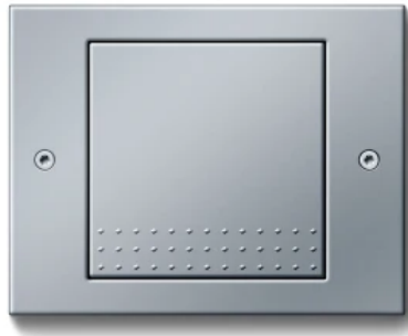
Gira TX_44, Farbe Alu