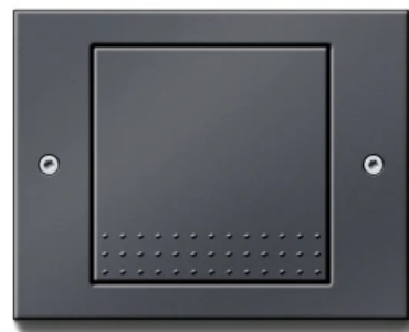
Gira TX_44, Anthrazit