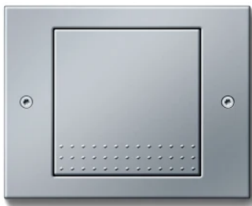
Gira TX_44, Farbe Alu