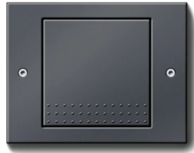
Gira TX_44, Anthrazit