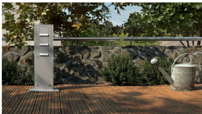
Gira TX_44, Einsatz im Außenbereich

Die Designlinie Gira TX_44 ist für den Einsatz im Außenbereich oder in Feuchträumen geeignet, findet aber genauso in der Innenraumgestaltung Anwendung. Sie lässt sich spritzwassergeschützt IP 44 installieren und bietet mit verstärktem Rahmen, robustem Material und der Möglichkeit zur wasser- und diebstahlgeschützten Montage, gute Voraussetzungen für die Anwendung im Garten, auf Balkonen oder Terrassen.