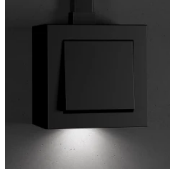
Gira E2, Beleuchtungselement für Aufputzgehäuse