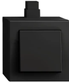
Gira E2, Schwarz matt, Aufputzgehäuse