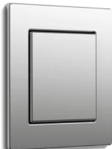
Gira E2, Edelstahl, flacher Einbau