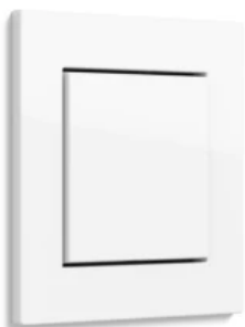
Gira E2, Reinweiß glänzend, flacher Einbau