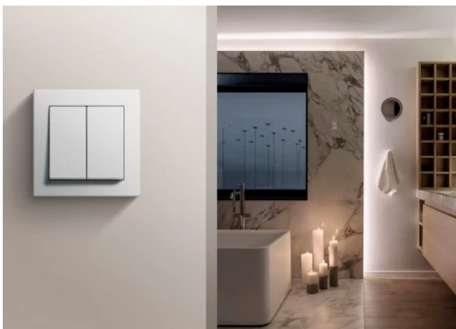
Gira E2, Standard-Einbau

Die reduzierte Formgebung und das ausgesuchte Farbdesign des Schalterprogramms Gira E2 fügen sich in verschiedene Einrichtungsstile ein. Hochwertige Materialien – von bruchsicherem, UV-beständigem Kunststoff bis hin zum hitzebeständigen Edelstahl – stehen zur Verfügung. Neben der normalen Bauart ist das Schalterprogramm Gira E2 in allen Varianten auch in flacher Bauweise und als Aufputzvariante erhältlich und kompatibel mit den über 300 Funktionseinsätzen aus dem Gira System 55.