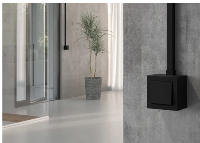
Gira E2 Aufputz

Zum einfachen Nachrüsten in fast jeder Umgebung eignen sich die Aufputzlösungen der Gira E2 Designlinie. Sie kann überall dort installiert werden, wo keine Leitungen oder Unterputzdosen vorverlegt sind. Dieses Programm ist in zwei Farboptionen ausgeführt.