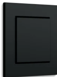
Gira E2, Schwarz matt, flacher Einbau