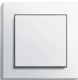
Gira E2, Reinweiß glänzend