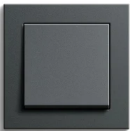
Gira E2, Anthrazit