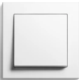
Gira E2, Reinweiß seidenmatt

Aus der Serie Gira Schalterprogramme Designlinien von Gira