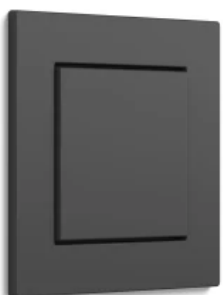
Gira E2, Anthrazit, flacher Einbau