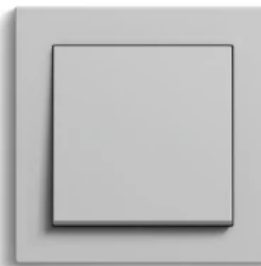
Gira E2, Grau matt