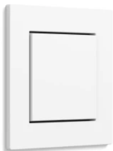
Gira E2, Reinweiß glänzend, flacher Einbau

Aus der Serie Gira Schalterprogramme Designlinien von Gira