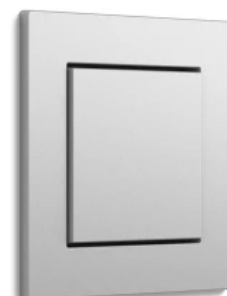
Gira E2, Farbe Alu, flacher Einbau