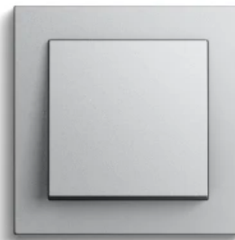
Gira E2, Farbe Alu