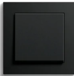
Gira E2, Schwarz matt