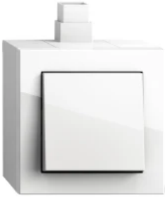
Gira E2, Reinweiß glänzend, Aufputzgehäuse

Aus der Serie Gira Schalterprogramme Designlinien von Gira