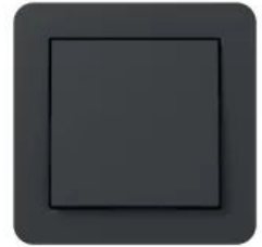
Gira E1 Anthrazit