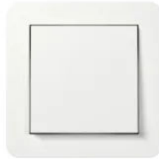
Gira E1 Reinweiß seidenmatt