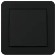
Gira E1 Schwarz matt