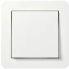
Gira E1 Reinweiß glänzend