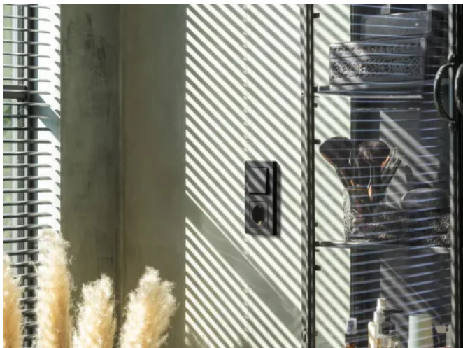
Schalterprogramm A FLOW