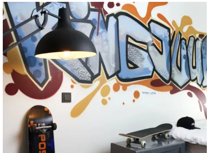
Schalterprogramm A FLOW