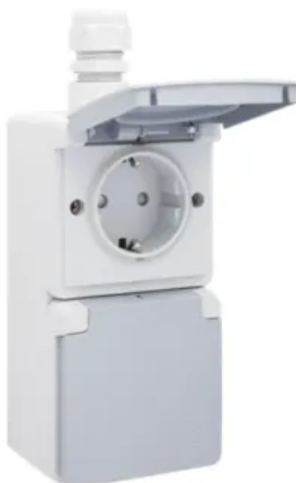
Spritzwassergeschützte Aufputz-Steckdose mit Schutzkontakt