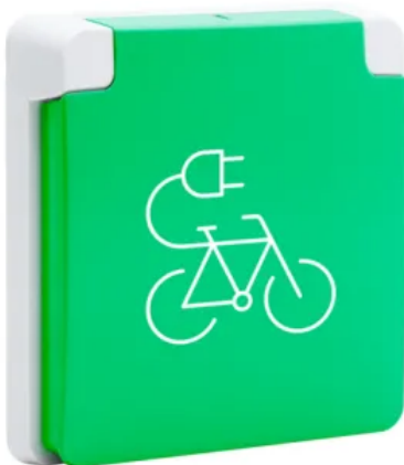
Spritzwassergeschützter Einsatz "Fahrradladestation 16 A/250 Vac"