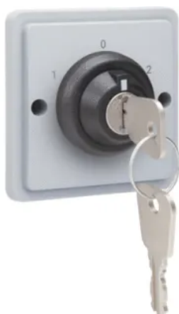
Spritzwassergeschützter Schlüsselschalter-Einsatz zum Öffnen und Schließen