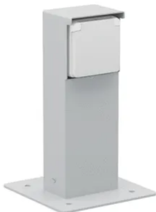
Spritzwassergeschützte Anschluss säule

Aus der Serie Schalter- und Steckdosensysteme für Innen- und Außenbereiche von Wygwan Deutschland