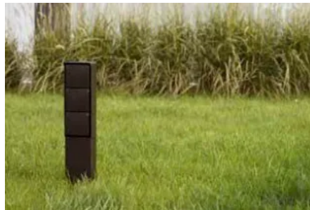
Anschlusssäule mit Dreifach-Steckdose

Einbau der Steckdose "Fahrradladestation" in Fassaden und Wänden