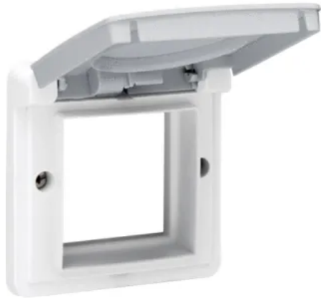
Spritzwassergeschützte Einsätze für Datenmodule

Aus der Serie Schalter- und Steckdosensysteme für Innen- und Außenbereiche von Wygwan Deutschland