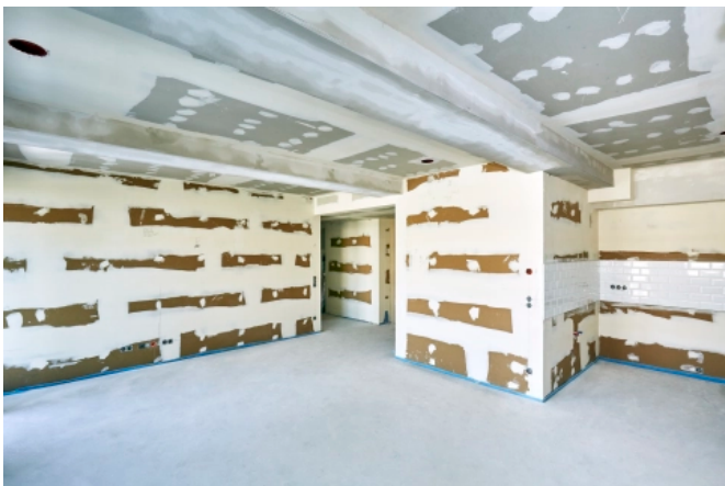
Moderne Knauf Trockenbau-Systeme erzielen einen zuverlässigen Schallschutz.

Moderne Knauf Trockenbau-Systeme erzielen einen zuverlässigen Schallschutz. Durch das Feder-Masse-Prinzip reduziert sich die Schallübertragung von Raum zu Raum. Die geringe Dicke der Bauteile spart zudem Platz und Gewicht. Auch bei Sanierungen im Massivbau lassen sich mit einer Vorsatzschale an den Außenwänden deutlich besserer Schallschutz erzielen.