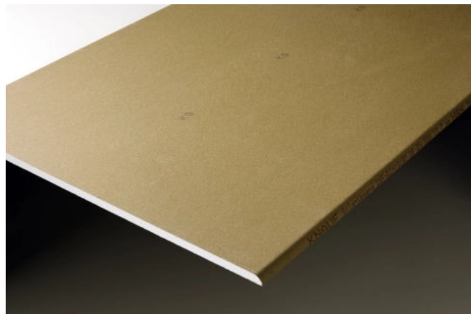
Knauf Silentboard ist eine Schallschutzplatte mit Spezialgipskern.

Knauf Silentboard GKF | Download Broschüre