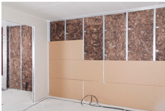
Trockenbau-Wände sind bei gleichen Schallschutzwerten wesentlich schlanker als ein verputztes Mauerwerk.