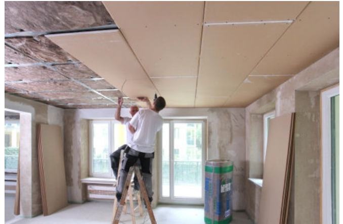
Bei Sanierungen erzielen Trockenbau-Unterdecken einen besseren Schallschutz an Holzbalkendecken.

Download Broschüre Knauf Silentboard Systeme