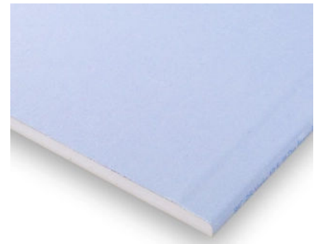
Rigips Die Blaue

Optimaler Schallschutz ist nach wie vor eine Herausforderung an Gebäudeplanung und -realisierung. Wichtig sind zuverlässige und leistungsstarke Konstruktionen, mit denen sich die vorgegebenen Zielwerte sicher erreichen lassen. Voraussetzung dafür ist, dass die betreffenden Bauteile in der entsprechenden Qualität geplant und verarbeitet werden. Nur wenn sich Bauplanung und -umsetzung optimal ergänzen, entstehen Schallschutzkonstruktionen, die alle gestellten Anforderungen mit Sicherheit erfüllen. Für den Ausbau-Profi Rigips hat das Thema Schallschutz schon immer besondere Priorität. Die Schallschutzplatte „Rigips Die Blaue“ hat in diesem Bereich Standards gesetzt.