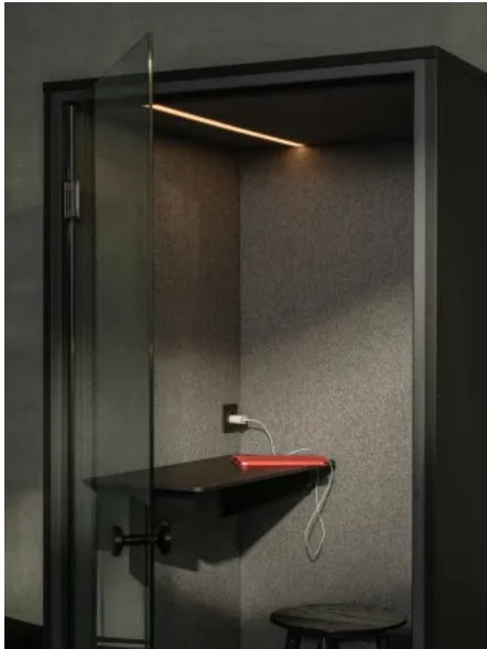
FOCUS Telefonkabine

Aus der Serie Telefon- und Meetingkabinen von Berlin Acoustics