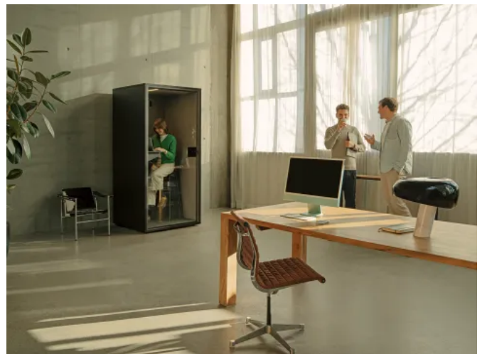
FOCUS Telefonkabine