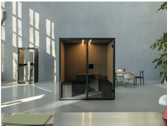
MEET - Meetingkabine