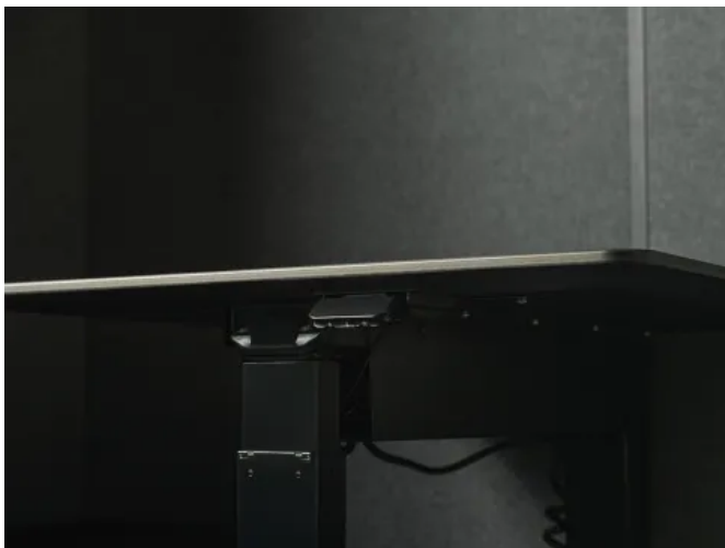
MEET - Meetingkabine