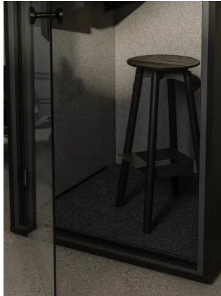
FOCUS Telefonkabine