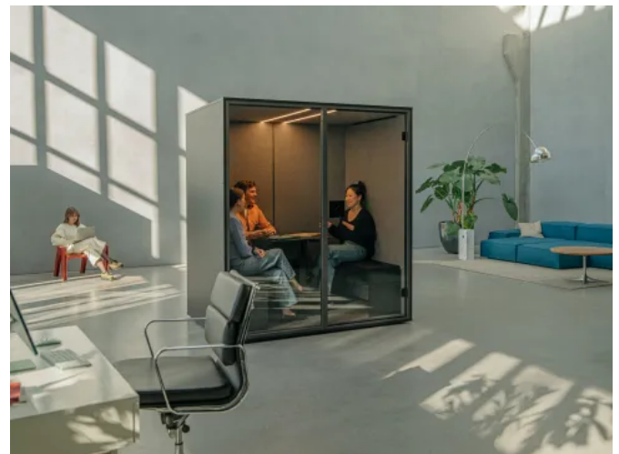
MEET - Meetingkabine

MEET ist eine Kabine für Meetings von 2 bis 4 Personen im Großraumbüro. Ein höhenverstellbarer Tisch ermöglicht Meetings im Stehen oder Sitzen. Mehrschichtige Wände sowie 8 mm starke Glaselemente garantieren eine Schallisolierung von 25,3 dB nach Klasse B nach ISO 23351-1.