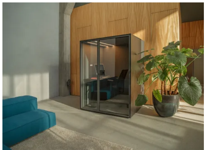
Mini-Office WORK (© Berlin Acoustics)