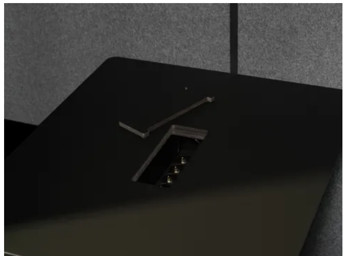
MEET - Meetingkabine