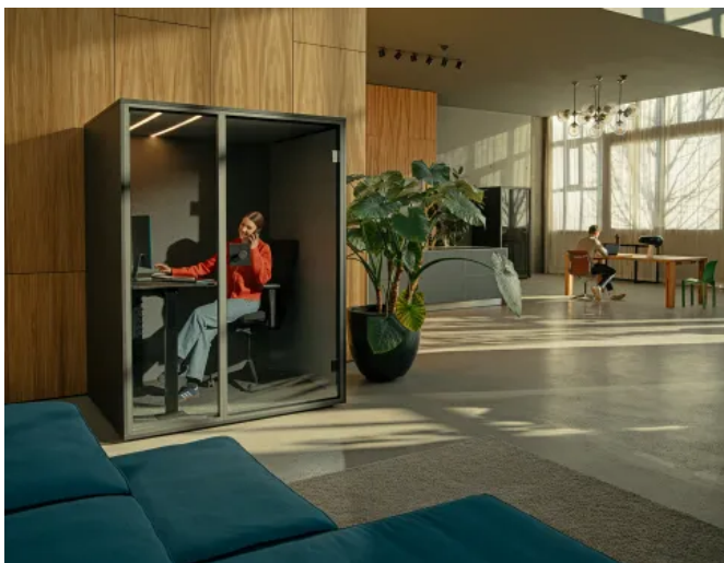
Mini-Office WORK