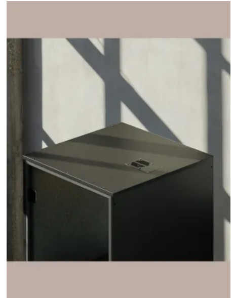
FOCUS Telefonkabine