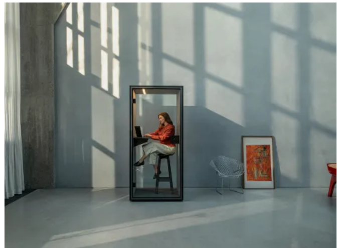
FOCUS Telefonkabine