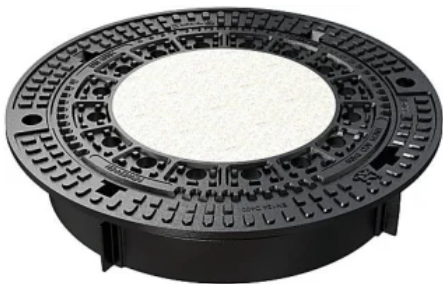
Schachtabdeckungen Duropren rund D 400 Lichte Weite 600