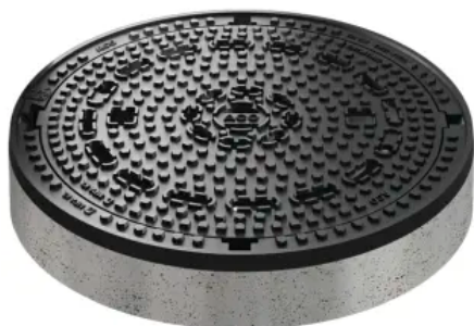
Schachtabdeckungen Multitop rund und quadratisch F 900 BEGU, Vollguss, BEGU quadratisch

Aus der Serie Schachtabdeckungen von ACO