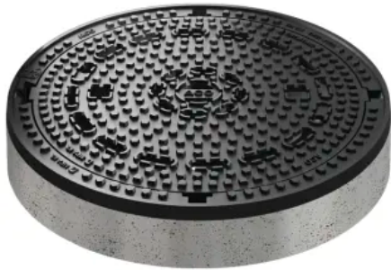
Schachtabdeckungen Multitop rund und quadratisch F 900 BEGU, Vollguss, BEGU quadratisch

Aus der Serie Schachtabdeckungen von ACO