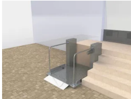
Mit flachen 6 cm Aufbauhöhe erfordert das Aufstellen des Vertico Solida M wenig Umbaumaßnahmen.