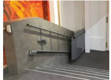
sani-trans Plattformlifte lassen sich standardmäßig elektrisch zusammenklappen.