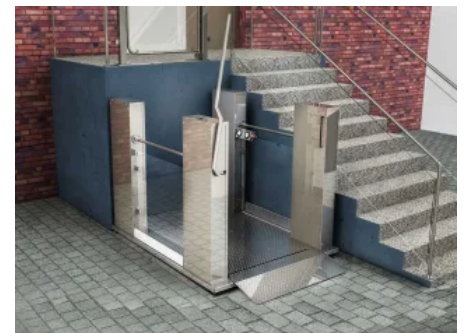
Die robusten Hublifte Vertico Quattro befördern auch schwere Elektro-Rollstühle und E-Mobile bis zu 1.790 mm hoch.