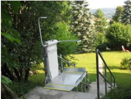
Der Plattformlift Plateau Linea eignet sich für gerade Treppen innen und außen.

Aus der Serie sani-trans Hub- und Plattformlifte von Liftstar