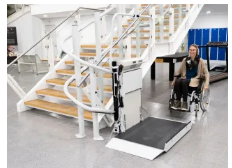
Der Plateau Flexa bietet verschiedene Plattformgrößen und Farbausführungen.