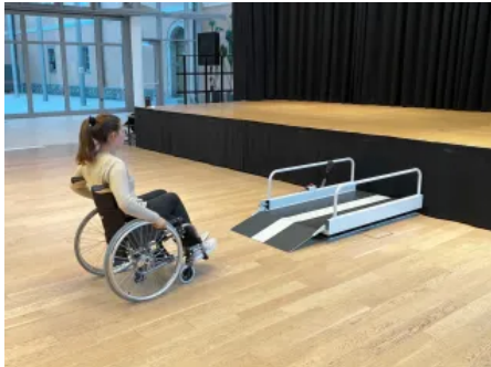
Hublifte Vertico Lite zeichnen sich durch ihr geringes Eigengewicht und ihre kompakte Bauweise aus.

Aus der Serie sani-trans Hub- und Plattformlifte von Liftstar