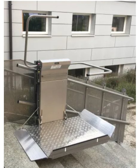
sani-trans® Plattformlifte ermöglichen die barrierefreie Überwindung ganzer Etagen direkt im Rollstuhl.