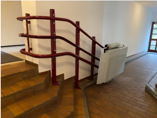
Der Plattformlift Plateau Flexa eignet sich für kurvige und gerade Treppen.