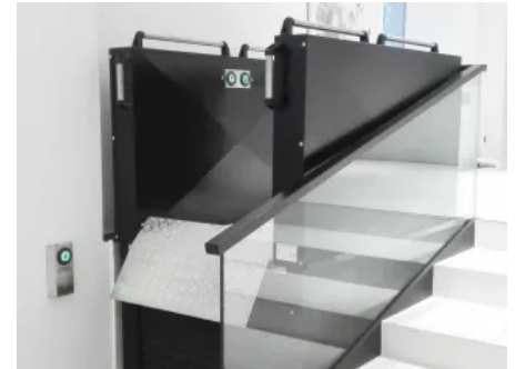
Die wetterfesten Hublifte Vertico Klassiko aus Edelstahl und Aluminium sind mit wenig Aufwand installierbar.