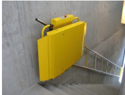
Plateau Linea ist in allen RAL-Farben oder Edelstahl erhältlich.