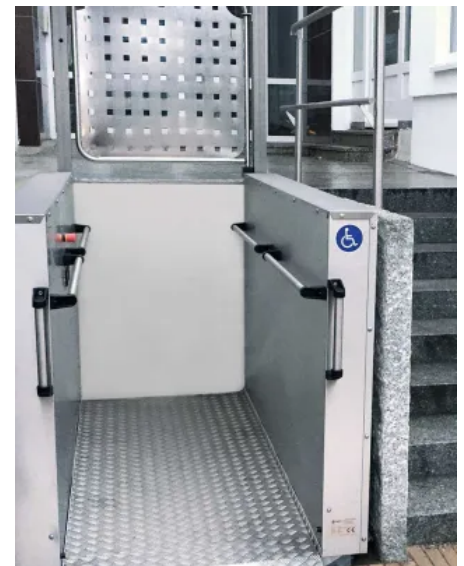
sani-trans® Hublifte benötigen keinen Treppenlauf und lassen sich flexibel im Innen- und Außenbereich einsetzen.