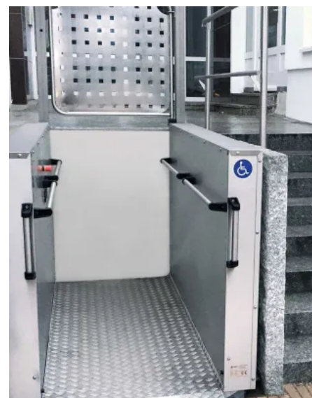
sani-trans® Hublifte benötigen keinen Treppenlauf und lassen sich flexibel im Innen- und Außenbereich einsetzen.