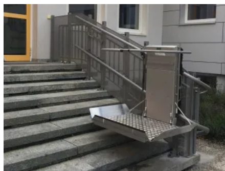
Die robuste, wetterfeste Liftkonstruktion sorgt für einen zuverlässigen Betrieb.