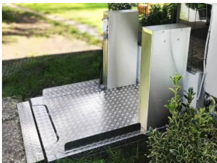
Hublifte Vertico Varia sind mit großer Wendefläche auf der Plattform, gerader Durchfahrt oder Über-Eck-Ausstieg erhältlich.