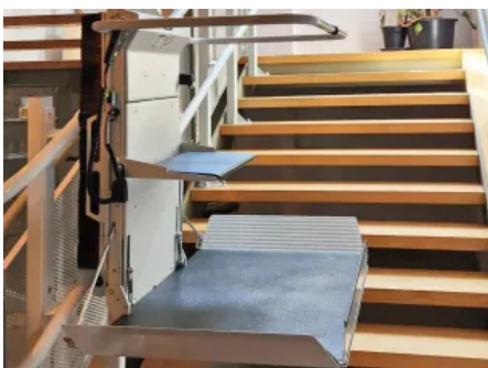
Auch ein nachträglicher Einbau von Plattformliften ist problemlos möglich.