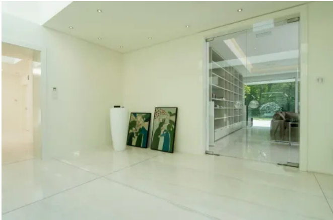
Beeindruckend und absolut auffällig sind Fliesen im XXL-Format mit Kantenlängen bis über drei Meter. Sie lassen sich mit SAKRET Systemlösungen vom Estrich bis zur Fuge realisieren.

Aus der Serie SAKRET Werk trockenmörtel von SAKRET-Trockenbaustoffe Europa