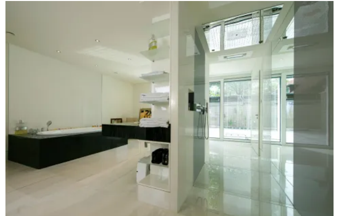
Hoch standfeste Fliesenkleber sind bei der Bodenverlegung Großformatfliesen das Maß der Dinge. Zum Einsatz kam deshalb der faserarmierte SAKRET Fließbettmörtel FBM.