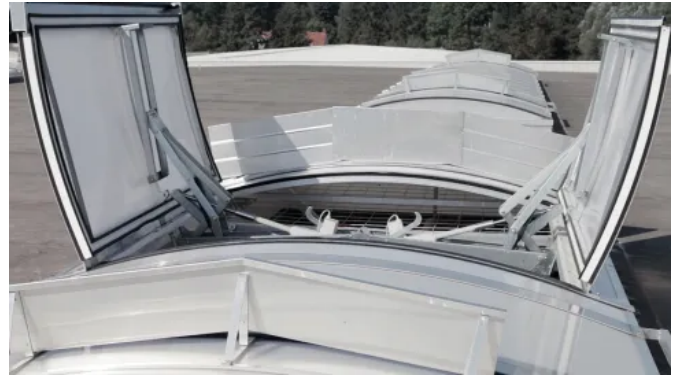
VARIO-THERM DK 95° 24V/48V

Auch für die Lüftungsfunktion ist dieses System geeignet. Der leise Motor erzeugt keine Störgeräusche und kommt daher vor allem in Präsentationsräumen, wie beispielsweise Autohäusern, oder Versammlungsstätten zum Einsatz.