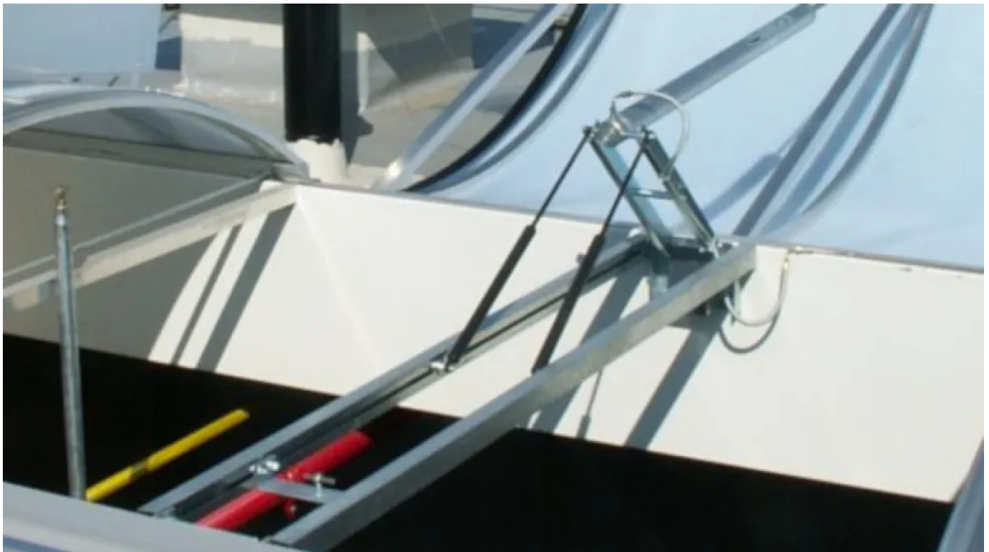
Pneumatische RWA-Komponenten für Lichtbänder

Im Brandfall kommt es zu einer großen Hitzeentwicklung. Auf diesem Umstand basiert die Wirkungsweise pneumatischer RWA-Beschläge . Die hohen Temperaturen führen dazu, dass ein Glasfässchen am Öffnerbeschlag zerspringt und anschließend die integrierte CO 2 -Patrone angestochen wird. Dadurch strömt das Gas in den Pneumatik-Zylinder, so dass sich der Rauchabzug automatisch öffnet. Die gefährlichen Gase und der Rauch können nun effektiv abziehen, wodurch die Flucht- und Rettungswege rauchfrei und begehbar bleiben.