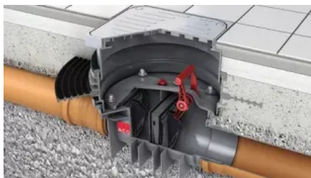
Triplex-K mit Schachtsystem