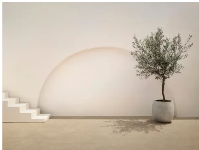
Feinsteinzeug Room in Steinoptik