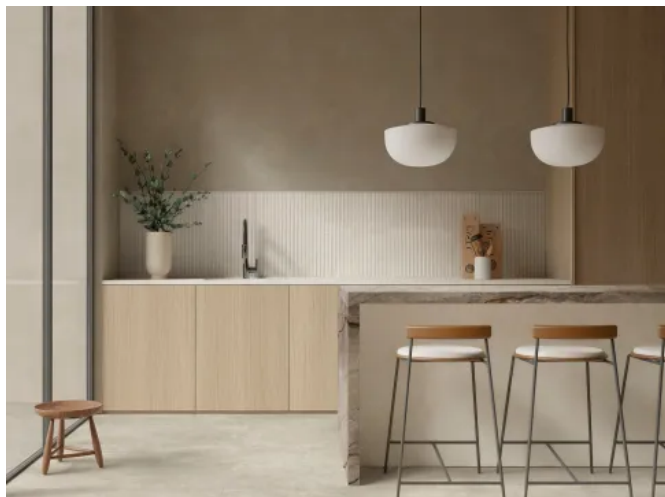
Feinsteinzeug Room / Room Wall in Steinoptik für Wand und Boden