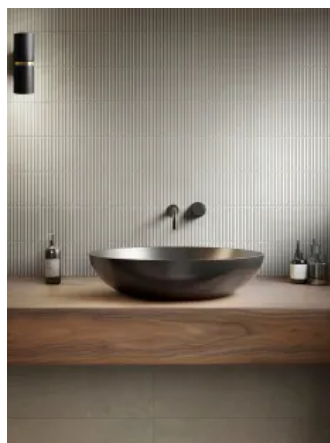
Feinsteinzeug Room Wall in Steinoptik für Wandverkleidungen