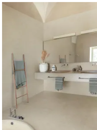
Feinsteinzeug Room / Room Wall in Steinoptik für Wand und Boden