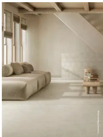
Feinsteinzeug Room in Steinoptik