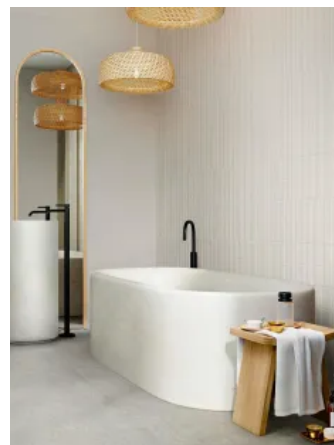
Feinsteinzeug Room / Room Wall in Steinoptik für Wand und Boden