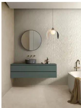
Feinsteinzeug Room / Room Wall in Steinoptik für Wand und Boden