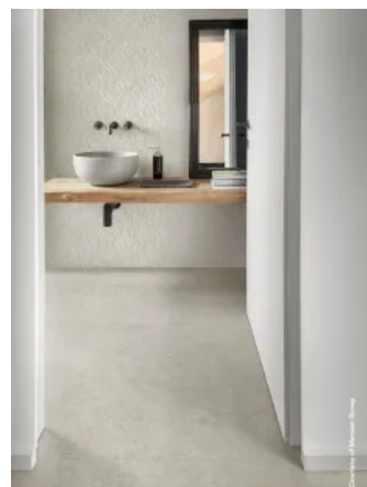
Feinsteinzeug Room / Room Wall in Steinoptik für Wand und Boden