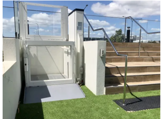
Optional sind Türen mit Acrylgleaseinsatz und Sonderfarben möglich.