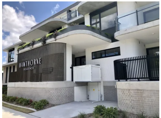
Der Savaria Multilift ist ein witterungsbeständiger Hublift ohne Schacht.