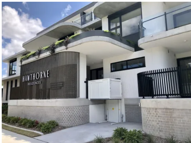
Der Savaria Multilift ist ein witterungsbeständiger Hublift ohne Schacht.