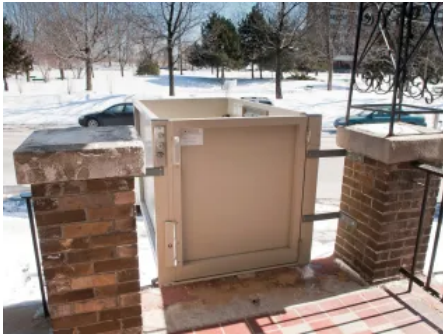
Der Lift wird bündig an der Betonkante befestigt und ist ebenerdig befahrbar.

Aus der Serie Liftlösungen von GARAVENTA Lift