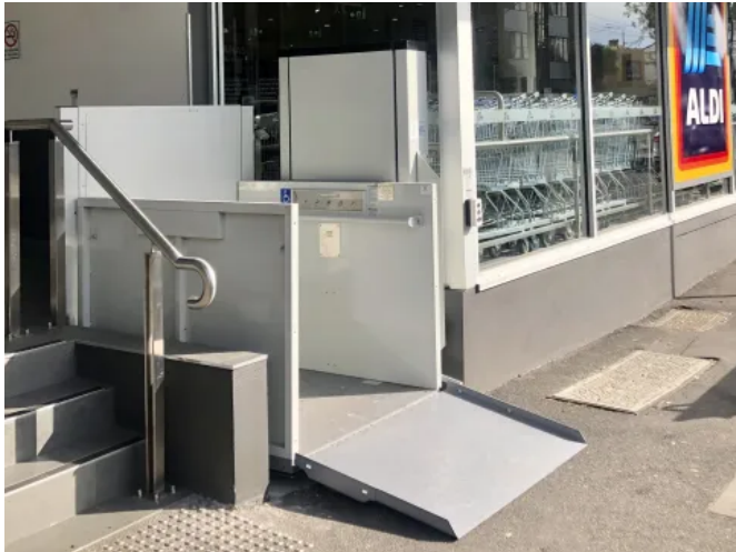
Der Multilift wird standardmäßig in Telegrau mit automatischer Auffahrrampe geliefert.

Aus der Serie Liftlösungen von GARAVENTA Lift