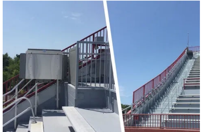
Der witterungsbeständige Artira Außen überwindet Treppen und Podeste barrierefrei über eine Länge von 60 Metern.