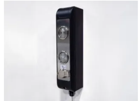
Optionale Rufstationen ermöglichen die Bedienung außerhalb des Plattformlifts.