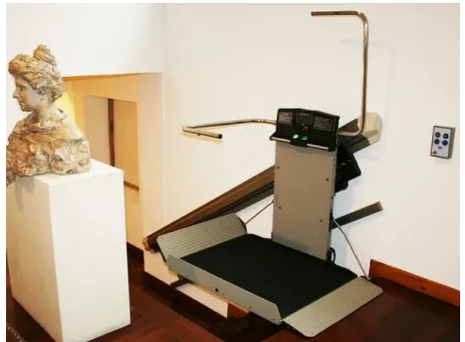
Der X3 ermöglicht einen barrierefreien Zugang an geradläufigen Treppen und bietet ausreichend Raum für gängige Rollstuhlmodelle.