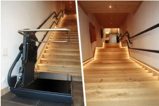
Mit verschiedenen Farben und Oberflächen passt sich der Artira Innen auch optisch den baulichen Gegebenheiten an.

Aus der Serie Liftlösungen von GARAVENTA Lift