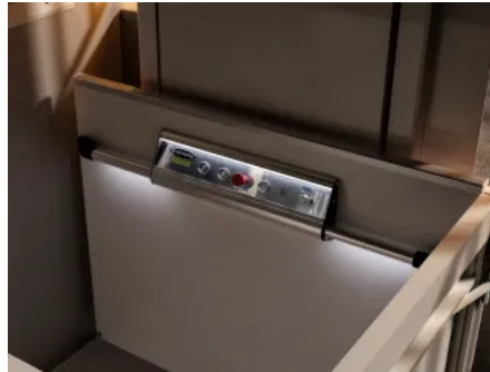
Das Bedientableau verfügt über beleuchtete Drucktasten und Diagnosedisplay.