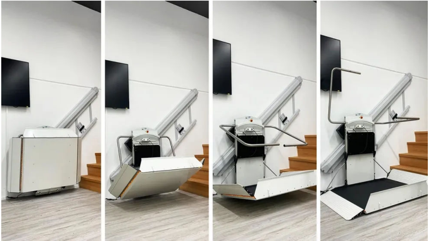
X3 ist ein platzsparender Plattformlift, der zusammengeklappt nur 34,5 cm der Treppenlaufbreite beansprucht.

Aus der Serie Liftlösungen von GARAVENTA Lift