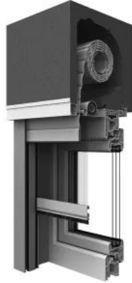
THERMplus Aufsatzelement TOP FOAM für Rollläden mit Revision von außen max. Breite: 3700 mm max. Höhe: 4000 mm max. Fläche: 8 m 2

Weitere Informationen: Aufsatzsysteme Rollläden