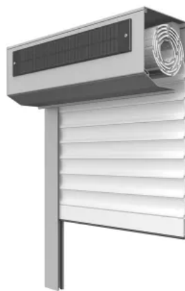
nova Vorbaurollladen stranggepresst - Solarpaket max. Breite: 3500 mm max. Höhe: 4000 mm max. Fläche: ca. 5 m 2