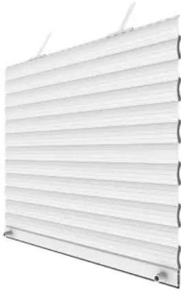
Einbaurollladen max. Breite: 4000 mm max. Fläche: 10 m 2

Aus der Serie HELLA Rollläden von HELLA Sonnenschutztechnik