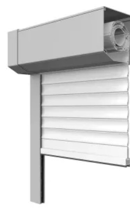
nova Vorbaurollladen stranggepresst - Top-Safe max. Breite: 2500 mm max. Höhe: 3000 mm max. Fläche: 6 m 2