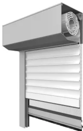
nova Vorbaurollladen stranggepresst max. Breite: 3500 mm max. Höhe: 4000 mm max. Fläche: 8 m 2