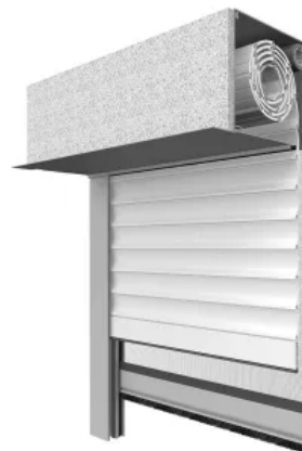
nova Vorbaurollladen stranggepresst mit Putzträger max. Breite: 3500 mm max. Höhe: 4000 mm max. Fläche: 8 m 2

Weitere Informationen: Putzträgersysteme Rollläden