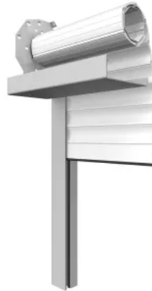
Schachtrollladen max. Breite: 3000 mm max. Fläche: 7,5 m 2

Weitere Informationen: Einbausysteme Rollläden