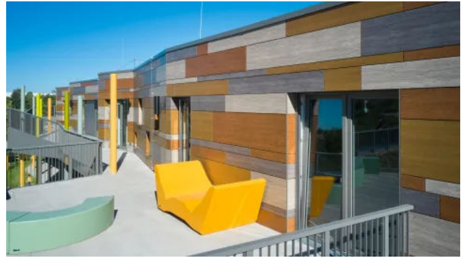
Rockpanel Platten und Profile sind in nahezu allen RAL/NCS Farben passend zum Design erhältlich.