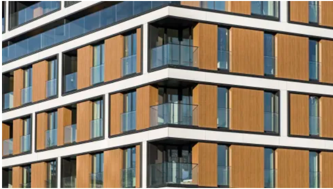
Rockpanel Fassadenplatten sind flexibel und biegsam, um der Form des Gebäudes zu folgen.