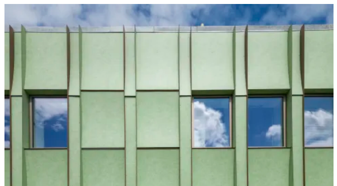
Rockpanel Stones vereint freie Gestaltung, leichte Verarbeitung, Nachhaltigkeit und Brandsicherheit.

Rockpanel Fassadenbekleidung - Produktsortiment