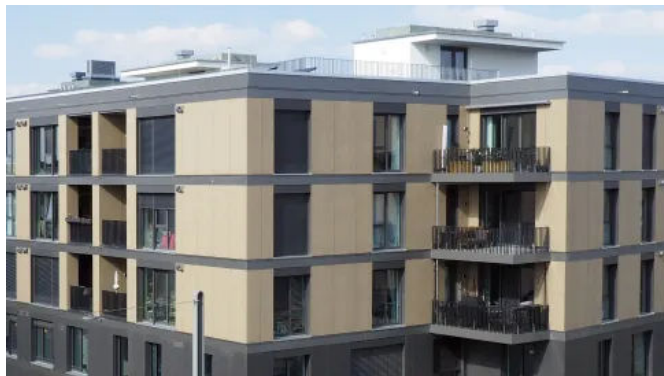
Rockpanel Stones erfüllt als hinterlüftete Fassadenverkleidung Anforderungen an eine hohe Brandsicherheit, sowohl im Neubau als für Bestand.