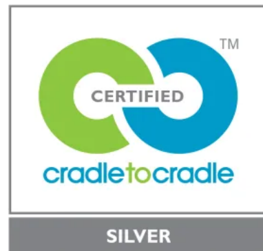
Rockpanel Stones ist ausgezeichnet mit Cradle to Cradle Certified® in Silber.

Rockpanel Fassadentafeln haben eine offiziell bestätigte Lebensdauer von 50 Jahren. Am Ende ihrer Zeit können sie demontiert und vollständig zu neuen, hochwertigen Steinwolle-Produkten recycelt werden.