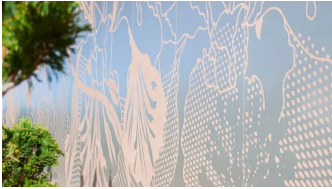
Rockpanel Stones besitzt die Langlebigkeit von Stein und ist einfach zu verarbeiten wie Holz.

Aus der Serie Rockpanel Fassadenbekleidungen aus natürlichem Basalt von Rockpanel