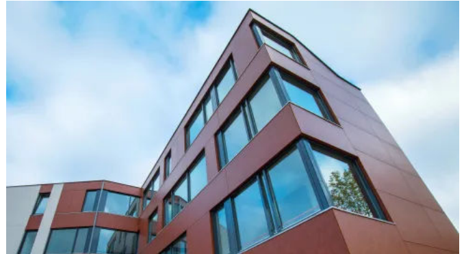
Rockpanel Stones Fassadenplatten sind nichtbrennbar nach Euroklasse A2-s1,d0 klassifiziert. Sie erhöhen die Brandsicherheit des Gebäudes.

Mit nichtbrennbaren Dämmstoffen wie ROCKWOOL Steinwolle-Dämmplatten und nichtbrennbaren Fassadenbekleidungen wie Rockpanel Fassadenplatten der Brandschutzklasse A2 (DIN EN 13501) müssen keine Kompromisse bei Design und Brandschutz eingegangen werden.