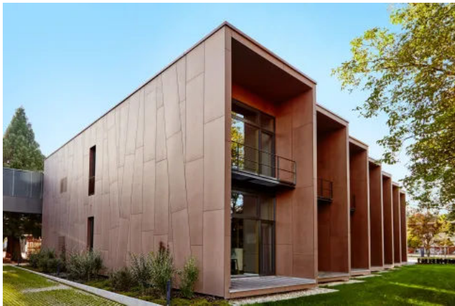
Rockpanel Fassadenplatten können auf vielfältige Weise montiert werden.