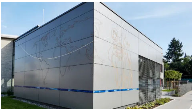
Eine hinterlüfteten Fassade mit Rockpanel A2 Fassadenplatten erhöht die die Brandsicherheit des Gebäudes.