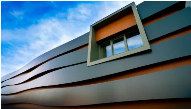
Rockpanel Metals Fassadenplatten sind leicht und dennoch robust. Sie sind stoßfest, sehr langlebig und unempfindlich gegen Feuchtigkeit.