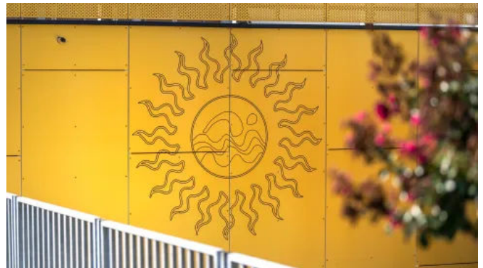
Rockpanel Metals lässt Ideen Wirklichkeit werden. Durch Fräsungen oder Perforationen erhält die Fassade ein ganz eigenes Aussehen.