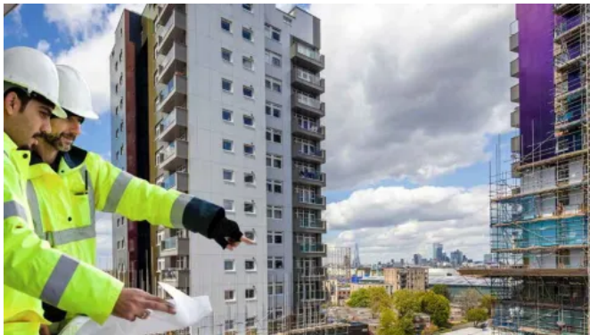
Eine hinterlüfteten Fassade mit Rockpanel A2 Fassadenplatten erhöht die Brandsicherheit des Gebäudes.