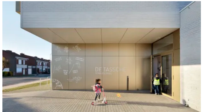
Rockpanel A2 Fassadenplatten sind geeignet, wenn eine hohe Brandsicherheit wünschenswert oder vorgeschrieben ist.