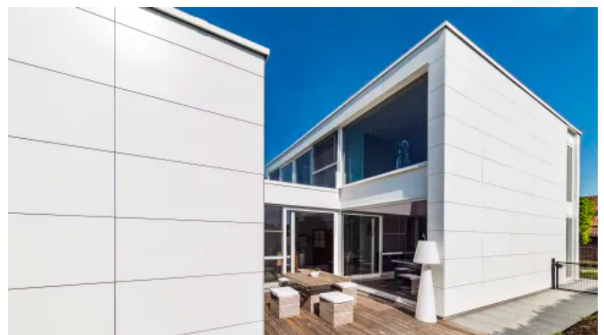
Rockpanel Fassadenplatten können auf vielfältige Weise montiert werden.