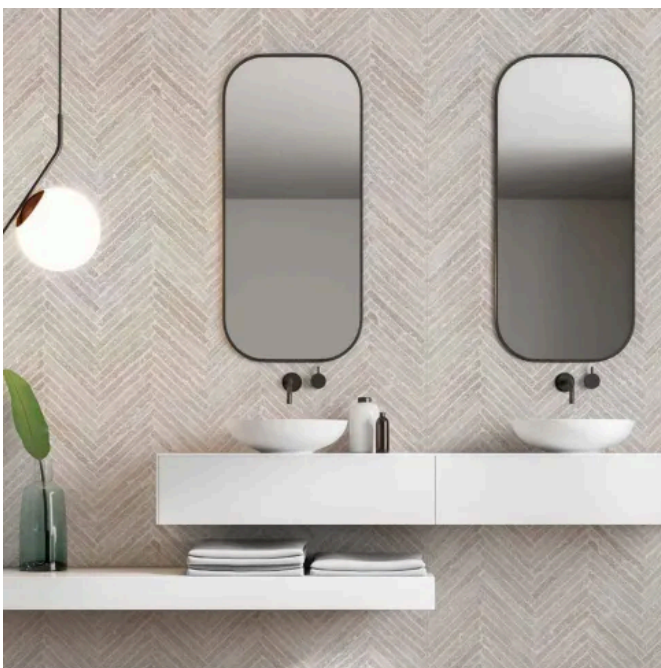
SPC Wandpaneele - R130 Greige Babylon