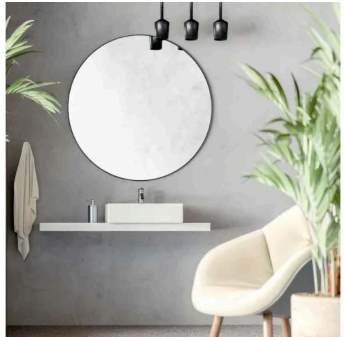
SPC Wandpaneele - Collection Stones