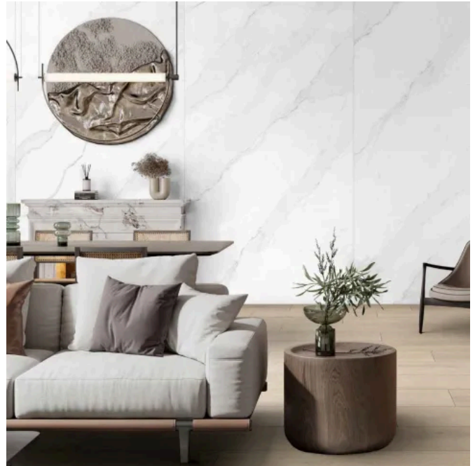
SPC Wandpaneele - K551 Calacatta Olympus