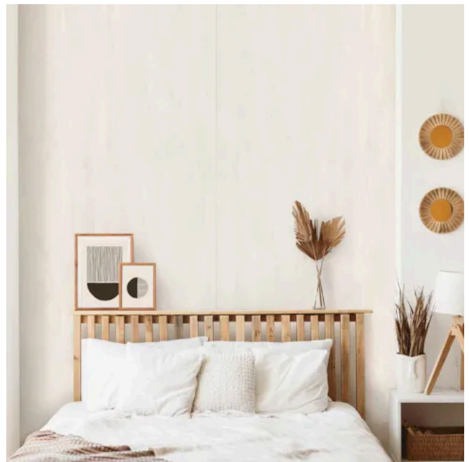
SPC Wandpaneele - K349 Silk Flow