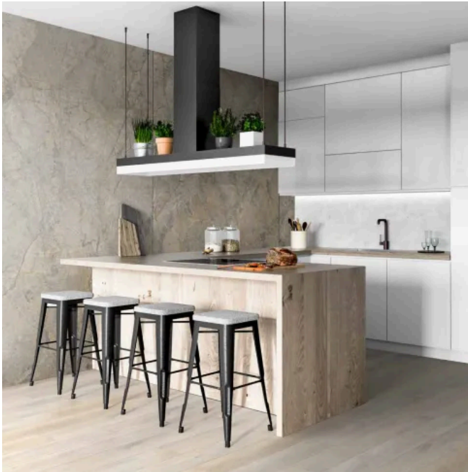
SPC Wandpaneele - R104 Rainforest Brown

Aus der Serie Kronodesign - Holzwerkstoffe für den Innenausbau von Kronospan