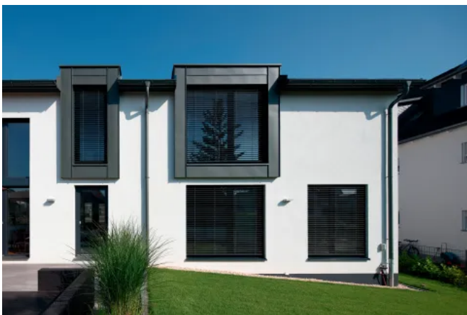
Bekleidung der Erker