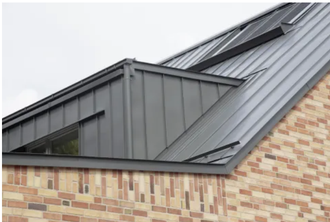
Dachgaube und Dachrand