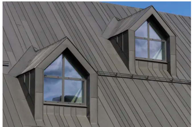
Dachgaube und Dachrandfläche