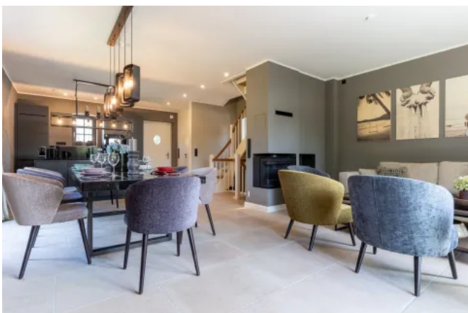
DeFries Kalksteinboden "Arcadia Pearl" - neu, antikisiert