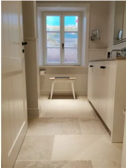
DeFries Kalksteinboden "Aix" - neu, antikisiert

Aus der Serie Mit ReUse-Baustoffen nachhaltig bauen und CO2 einsparen von DeFries - Baustoffe mit Geschichte