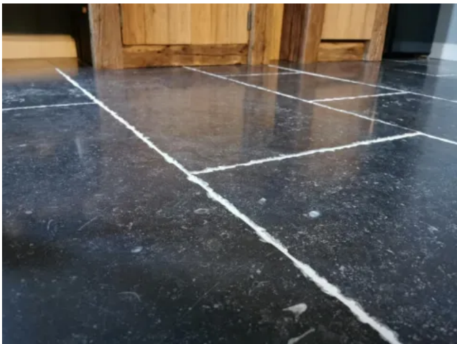
DeFries Bodenbeläge "Blaustein" - Bahnenware

Oberfläche gebürstet, Kanten leicht getrommelt