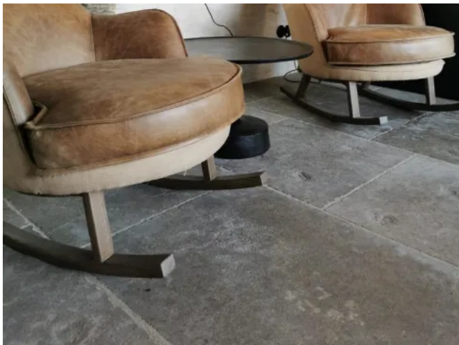
DeFries Kalksteinboden "Noorden" - neu, antikisiert

Rustikale Oberfläche, Geschlagene Kanten