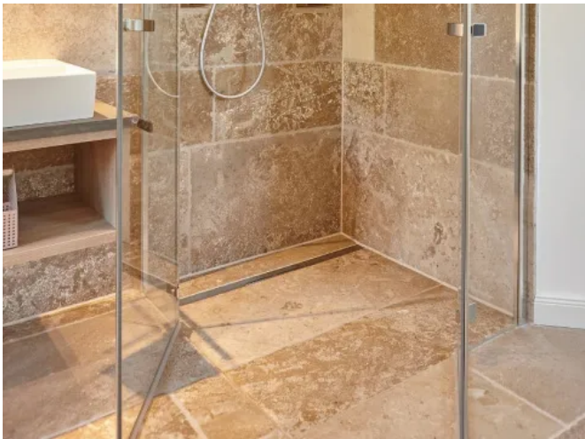
DeFries Kalksteinboden "Bayonne" - neu, antikisiert

Oberfläche antikisiert, Kanten antikisiert