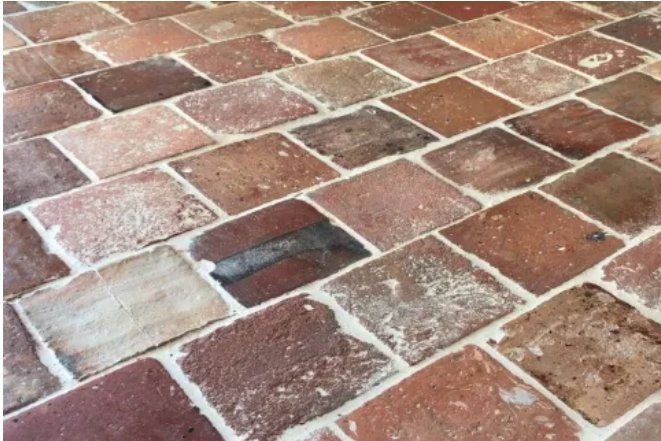
ReUse Terracotta Bodenplatten Rot nuanciert

Für besondere Bauvorhaben, bei denen an die Aufbauhöhen keine Anforderungen gestellt werden, ist die Lieferung von antiken Platten mit wesentlich mehr Materialstärke möglich. Die Unterseiten dieser Platten sind nur grob behauen und werden im sogenannten Dickbettverfahren verlegt.