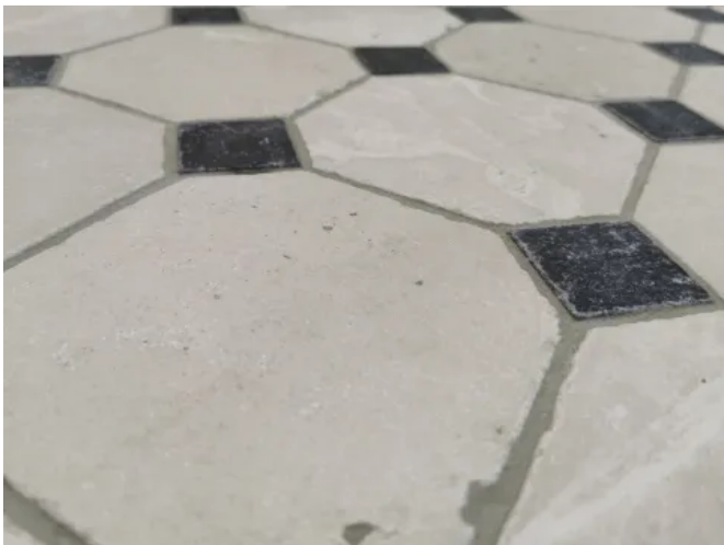
Achteckfliese Marmor Antik