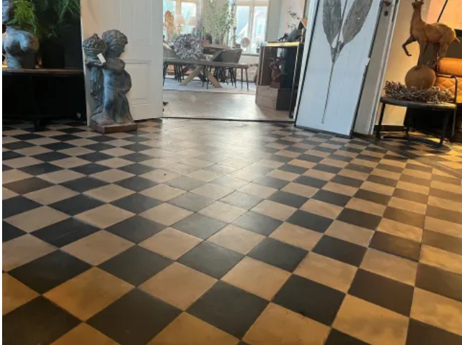
ReUse Zementfliesen in Schachbrettmuster

Aus der Serie Mit ReUse-Baustoffen nachhaltig bauen und CO2 einsparen von DeFries - Baustoffe mit Geschichte