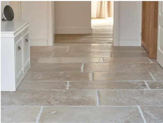
DeFries Kalksteinboden "Montpellier" - neu, antikisiert

De Fries bietet neben den recycelten, historischen Bodenplatten eine große Auswahl an antikisierten Bodenplatten aus Kalkstein in unterschiedlichen Formaten und Oberflächen.