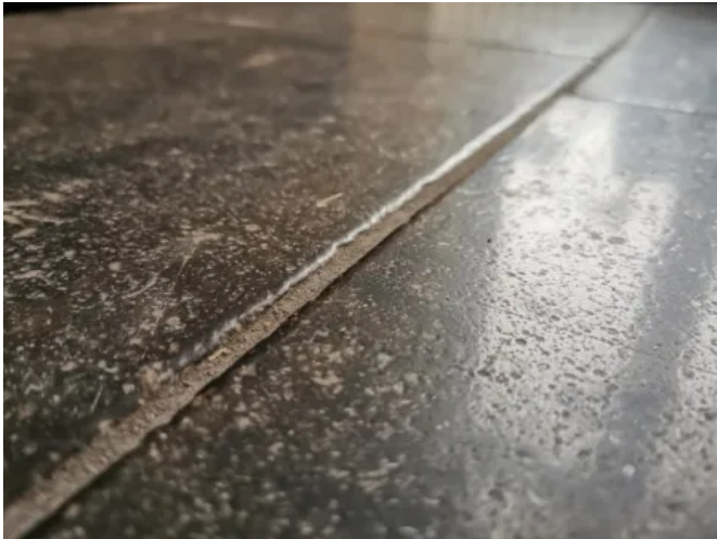
DeFries Bodenbeläge "Blaustein" - quadratisch

Aus der Serie Mit ReUse-Baustoffen nachhaltig bauen und CO2 einsparen von DeFries - Baustoffe mit Geschichte