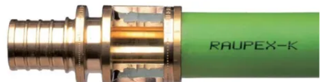
Schiebehülsenverbindung im Schnitt