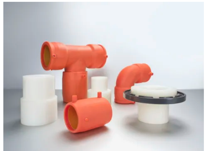
FUSAPEX Verbindungstechnik für das RAUPEX Industrierohrsystem