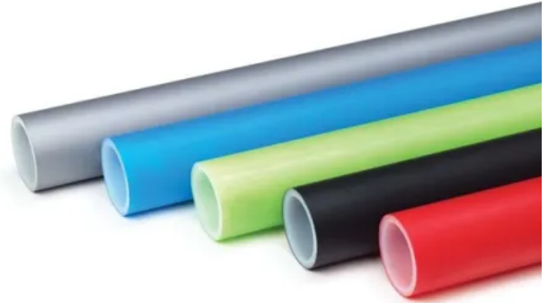
RAUPEX Rohrfarben in Anlehnung an DIN 2403

In der Farbe Rot für die Heizungsinstallation, sind die Rohre zusätzlich mit einer Sauerstoffsperrschicht ausgestattet, um das Eindringen von Sauerstoff in geschlossene Kreisläufe zu minimieren. RAUPEX Rohre sind frei von Schwermetallionen, Halogenen und lackbenetzungshemmenden Stoffen.