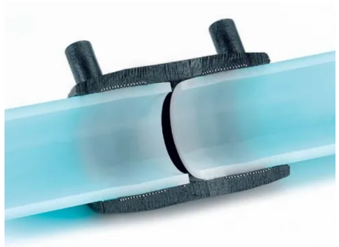
Elektroschweißmuffenverbindung im Schnitt

Durch eingebaute Stifte, die während des Schweißens hervortreten, kann jeder Fitting optisch auf eine bereits erfolgte Schweißung überprüft werden. REHAU ESM-Muffen bestehen aus schwarzem UV-stabilisiertem Polyethylen (PE 100). Die Außenschicht der Rohre ist unmittelbar vor einem Schweißvorgang durch Abschaben oder Abschälen zu entfernen.