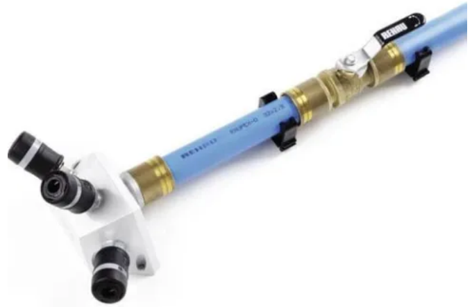
Die Druckluftverteilerdose kann direkt mit der RAUPEX-Rohrleitung verbunden werden.