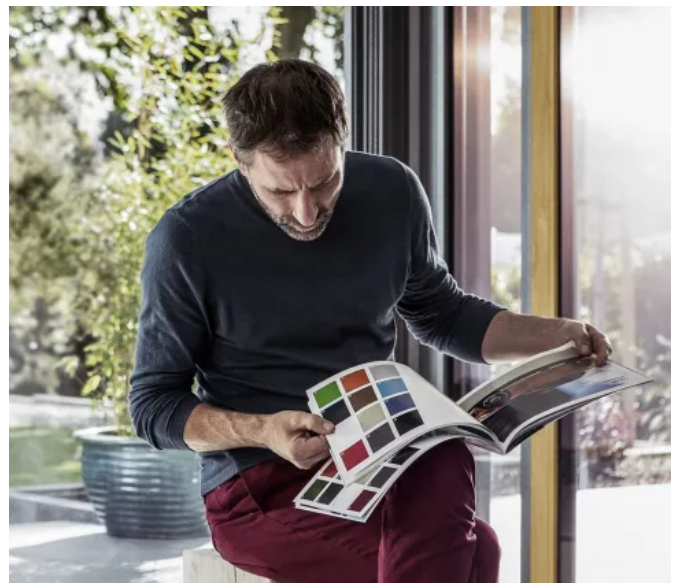
Gestaltung mit KALEIDO COLOR

Synego Haustüren bieten durch die Kombination mit unterschiedlichen Füllungen und Verglasungen und die große Farbvielfalt zahlreiche architektonische Möglichkeiten. Mit KALEIDO COLOR stehen mehr als 400 Designmöglichkeiten zur Gestaltung zur Auswahl. Für Lackierungen nutzt REHAU wasserbasierte KALEIDO PAINT Fensterlacke. Diese werden CO 2 -neutral gefertigt und sind mit der Cradle to Cradle® Zertifizierung in Silber für die Kreislauf- und Recyclingfähigkeit ausgezeichnet. Alle Oberflächenvarianten sind witterungsbeständig, resistent gegen Umwelteinflüsse, hoch lichtecht und pflegeleicht. Weitere Informationen zu KALEIDO COLOR