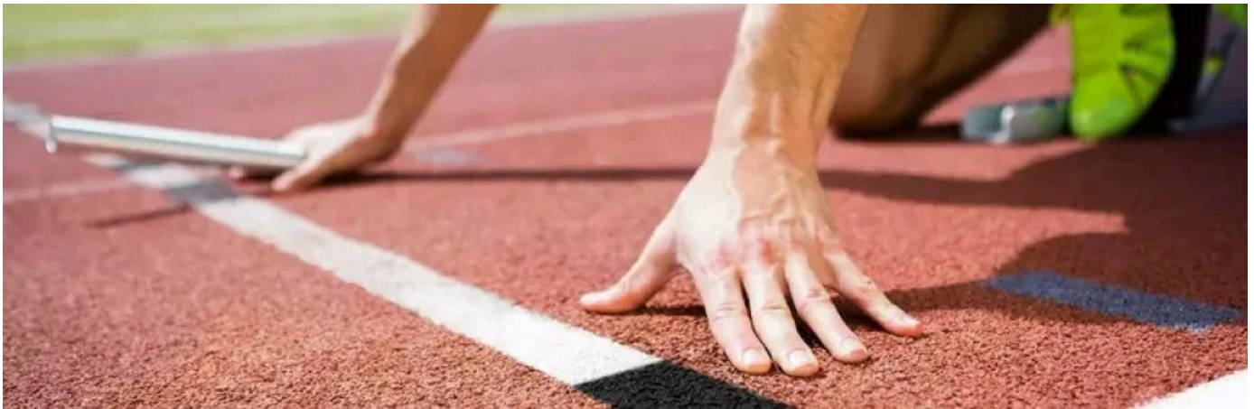
REGUPOL Laufbahnen für Mittel- und Langstreckentraining

REGUPOL Kunststofflaufbahnen speziell das Mittel- und Langstreckentraining schonen mit ihren speziellen Materialeigenschaften den Bewegungsapparat der Sportler und beugen damit Schmerzen und Verletzungen vor.