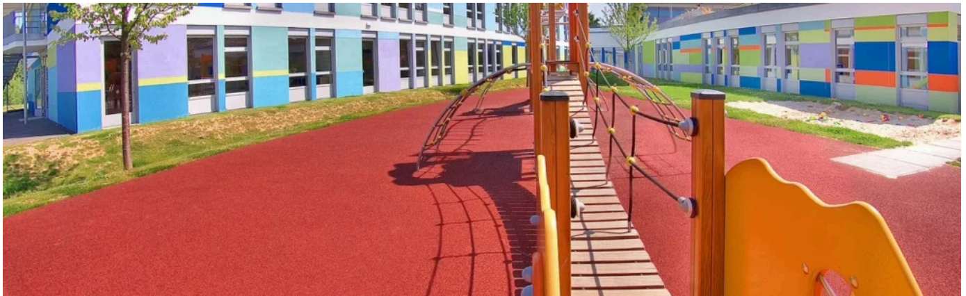
REGUPOL Fallschutzböden für Spielplätze

Die fugenlosen und barrierefreien REGUPOL playfix Fallschutzböden für Spielplätze reduzieren mit ihrer rauen Materialstruktur die Rutschgefahr – auch auf feuchten Oberflächen.