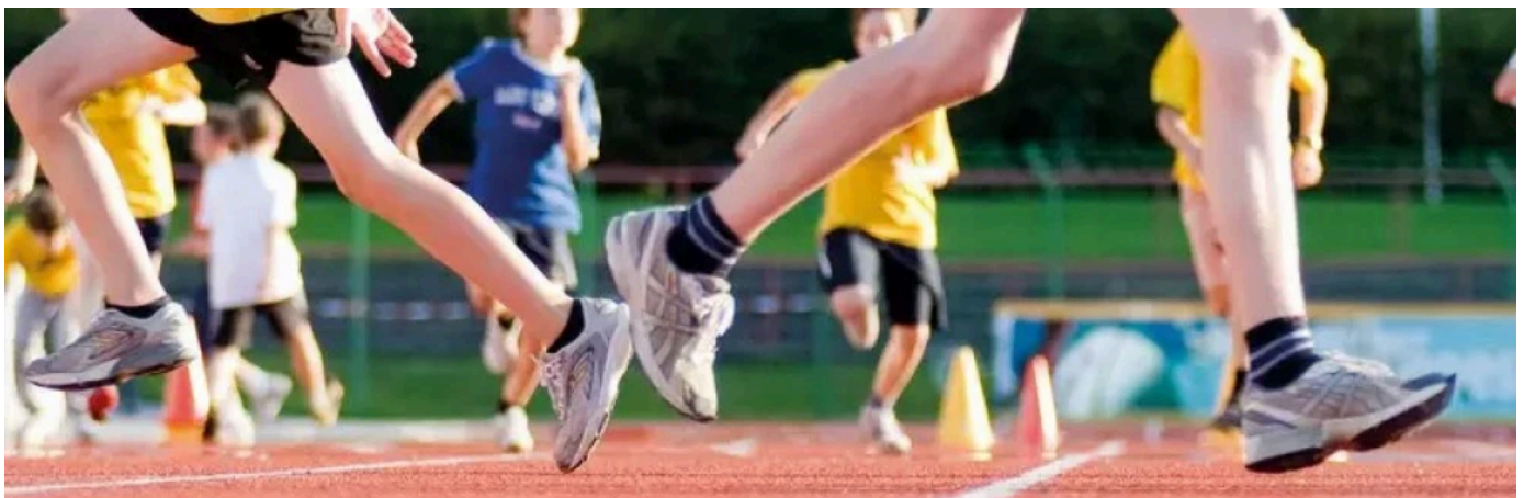
REGUPOL Laufbahnen für den Schul- und Breitensport

REGUPOL Kunststofflaufbahnen für den Schul- und Breitensport sind der geeignete Untergrund für Aktivitäten, die sich nicht am Hochleistungssport orientieren. Sie sind vielseitig einsetzbar, langlebig und nachhaltig.