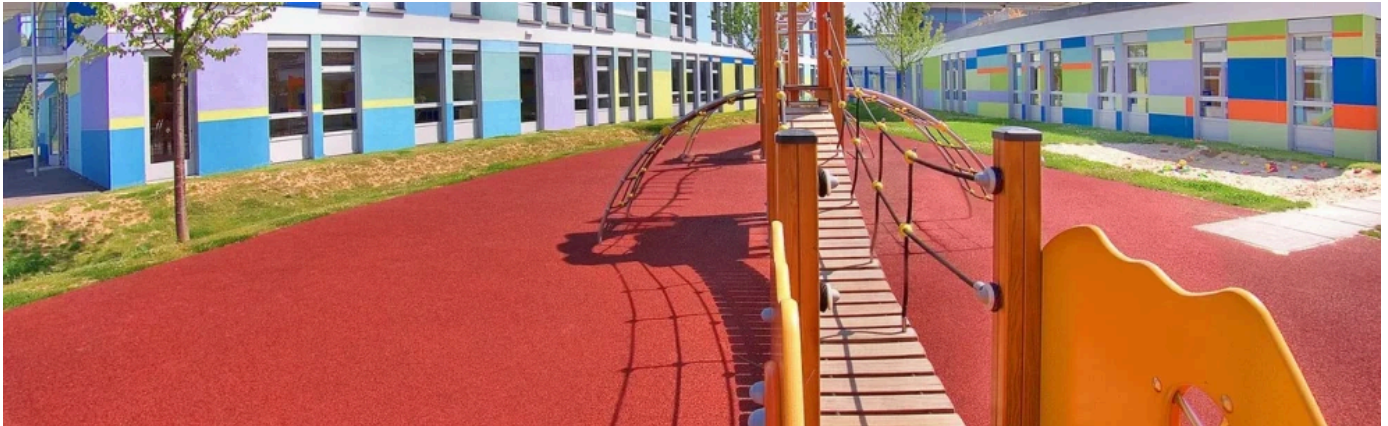
REGUPOL Fallschutzböden für Spielplätze

Die fugenlosen und barrierefreien REGUPOL playfix Fallschutzböden für Spielplätze reduzieren mit ihrer rauen Materialstruktur die Rutschgefahr – auch auf feuchten Oberflächen.