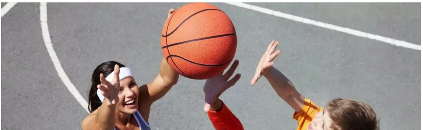
REGUPOL Sportböden für Mehrzweckspielfelder