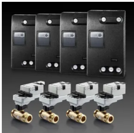
„Regumaq XZ-30“ mit „Regumaq K-4“