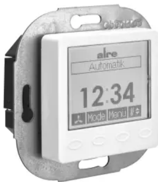
Klimaregler, elektronisch - Design Berlin UP - KTRRUu-257.456#27/V2