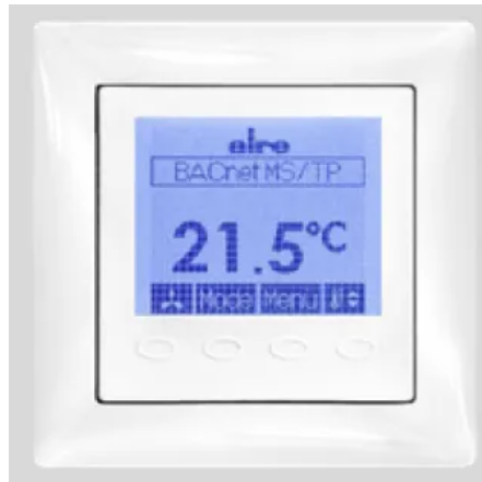
Busch Jaeger Adaptionbeispiel