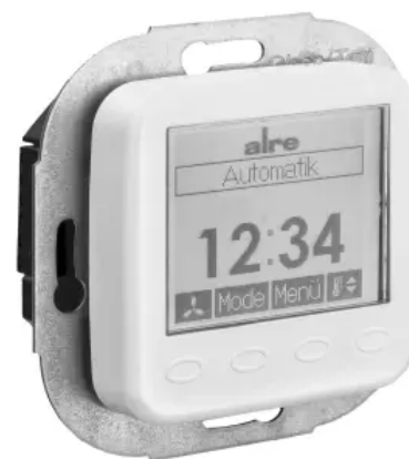
Klimaregler, elektronisch - Design Berlin UP - KTRRUu-257.456#28/V2