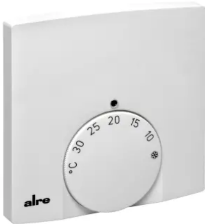
Klimaregler - Design Berlin 1000 - KTRTB-211.108

Aus der Serie Gebäudeautomation, Heiz-, Klima- und Anlagentechnik von ALRE-IT Regeltechnik