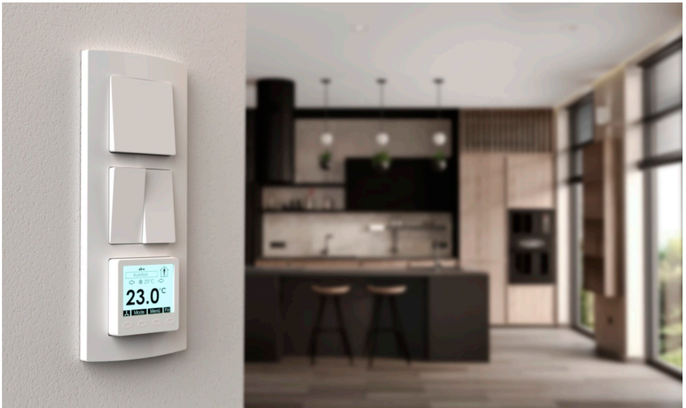
KTRRUu in Mehrfachrahmen integriert