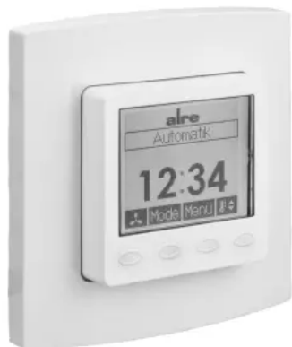
Klimaregler, elektronisch - Design Berlin UP - KTRRUu-257.456#21/V2

Aus der Serie Gebäudeautomation, Heiz-, Klima- und Anlagentechnik von ALRE-IT Regeltechnik