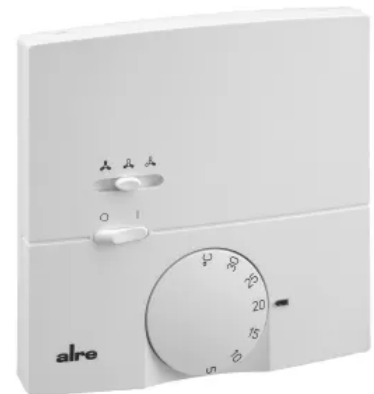
Klimaregler - Design Berlin 3000 - KTBSB-112.000

Die Berlin 1000 Reihe umfasst flache Thermostate mit 13,9 mm Dicke für Standard-Warmwassersysteme.