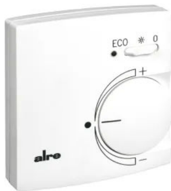
Klimaregler - Design Berlin 2000 - KTRRB-052.245