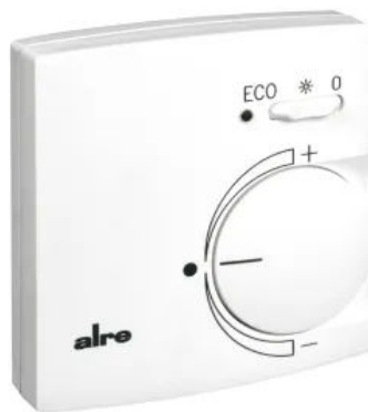
Klimaregler - Design Berlin 2000 - KTRRB-052.245