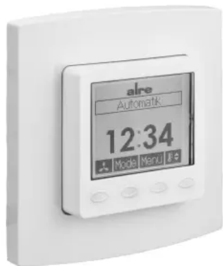
Klimaregler, elektronisch - Design Berlin UP - KTRRUu-257.456#21/V2

Aus der Serie Gebäudeautomation, Heiz-, Klima- und Anlagentechnik von ALRE-IT Regeltechnik