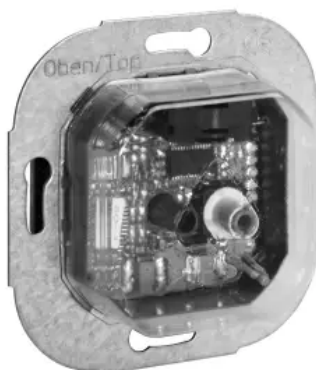
Klimaregler, elektronisch - KTRRU-052.245_00

Alle Unterputzregler passen in jeden handelsüblichen Schalterrahmen