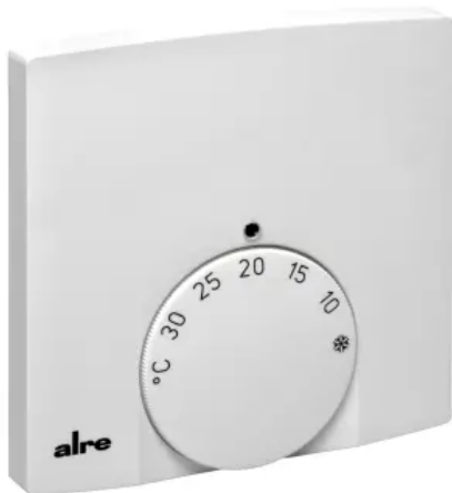
Klimaregler - Design Berlin 1000 - KTRTB-211.108

Aus der Serie Gebäudeautomation, Heiz-, Klima- und Anlagentechnik von ALRE-IT Regeltechnik