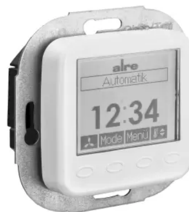
Klimaregler, elektronisch - Design Berlin UP - KTRRUu-257.456#28/V2