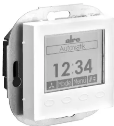
Klimaregler, elektronisch - Design Berlin UP - KTRRUu-257.456#55/V2