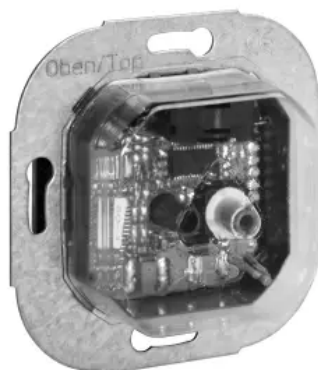
Klimaregler, elektronisch - KTRRU-052.245_00

Alle Unterputzregler passen in jeden handelsüblichen Schalterrahmen