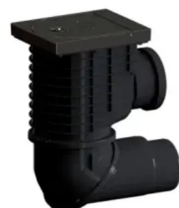
Regenwasserablauf 600 NGHO