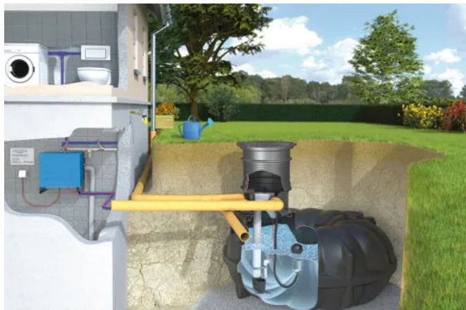
Haus-Komplettanlage NEO McRain mit Steuerungstechnik im Haus