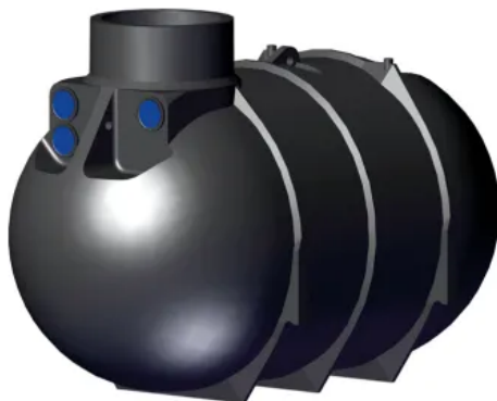
Klassischer, zylindrischer Erdtank: BlueLine II