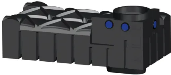
Minimale Einbautiefe, geringer Erdaushub: Flachtank F-Line

Aus der Serie Regenwasser-Nutzungsanlagen Rewatec von PREMIER TECH Rewatec