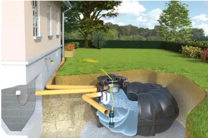
Garten-Komplettanlage Evo – Mit besonders leistungsstarker Tauchdruckpumpe und Wasserentnahme im Tankdeckel

Aus der Serie Regenwasser-Nutzungsanlagen Rewatec von PREMIER TECH Rewatec