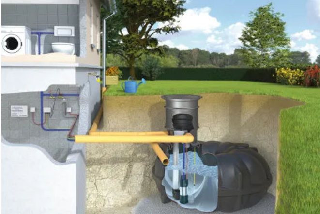
Haus-Kompletanlage NEO Diver mit Tauchdruckpumpe Diver

Aus der Serie Regenwasser-Nutzungsanlagen Rewatec von PREMIER TECH Rewatec