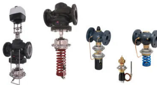
Differenzdruck-, Volumenstrom- und Temperaturregler