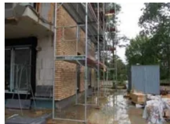
Sockeldämmung mit RAVATHERM™ XPS X