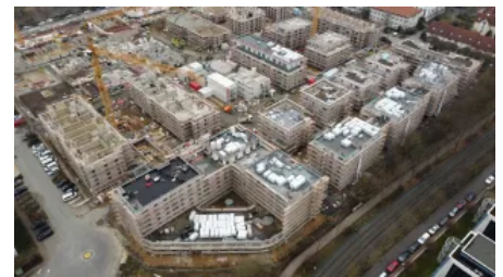
Rhein-Main-Gebiet: Quartierentwicklung mit 6.000 m 2 Dachfläche