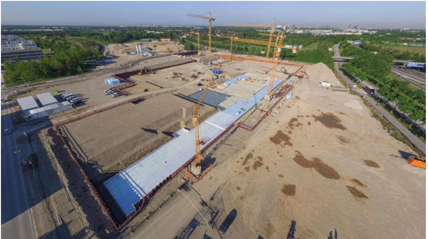
RAVATHERM™ XPS 700 SL als Dämmung für die Gründungsplatten der Gebäude und der Schwimmanlage

Rund 2.500 Schülerinnen und Schüler haben im September 2022 den neuen Bildungscampus in Riem im Osten Münchens bezogen. Das neue Schulzentrum ist mit großzügigen Sportanlagen und einem Schwimmbecken ausgestattet. Fachleute empfehlen für die Perimeterdämmung die XPS-Dämmstoffe von Ravago Building Solutions. RAVATHERM™ XPS 700 SL Dämmstoffplatten sind aufgrund einer Langzeitdruckbelastbarkeit nach EN 1606 von 250 kPa für Anwendungen mit sehr hoher Druckbelastbarkeit geeignet. Sie werden als Dämmung für die Gründungsplatten der Gebäude und der Schwimmanlage eingesetzt.