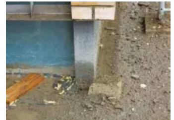
Sockeldämmung mit RAVATHERM™ XPS X