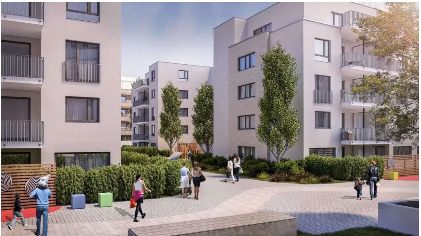
XPS-Dämmstoff für anspruchsvolle Anwendungen

Ein Retentionsdach auf WU-Beton-Basis baut sich wie folgt auf: Auf die Decke aus wasserundurchlässigem Beton folgt eine XPS-Dämmung, Trennlage, Retentionsboxen, Kies sowie Substrat beziehungsweise Terrassen oder Dachbegrünungen. Ganz ohne klassische Abdichtung ist diese Bauweise nicht nur besonders langlebig und robust – sondern mit Begrünung und Retention ebenso eine nachhaltige Lösung. Damit das System auch aus energetischer Sicht Vorteile bringt, kommt es auf die Auswahl des XPS-Dämmstoffs an. Die Sperrbeton-Spezialisten der Jürgen Paust GmbH, die das Retentionsdach in Solingen herstellen, verwenden dabei RAVATHERM XPS 300 SL von Ravago Building Solutions.