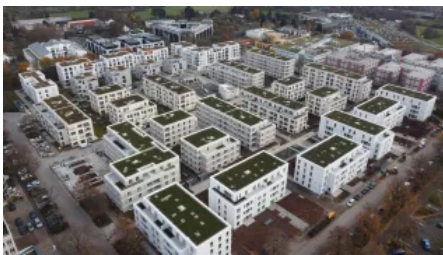
Rhein-Main-Gebiet: Quartierentwicklung mit 6.000 m 2 Dachfläche