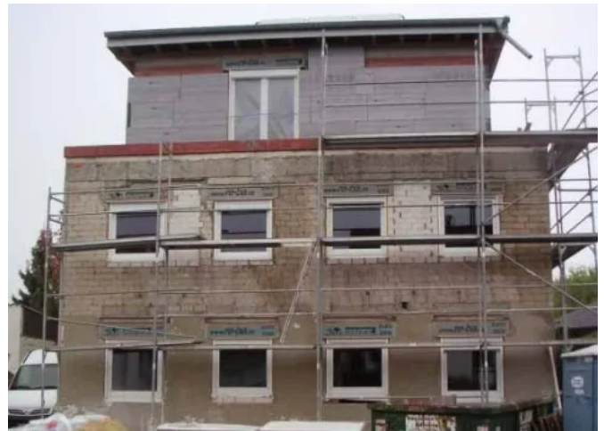
Kerndämmung mit RAVATHERM™ XPS X