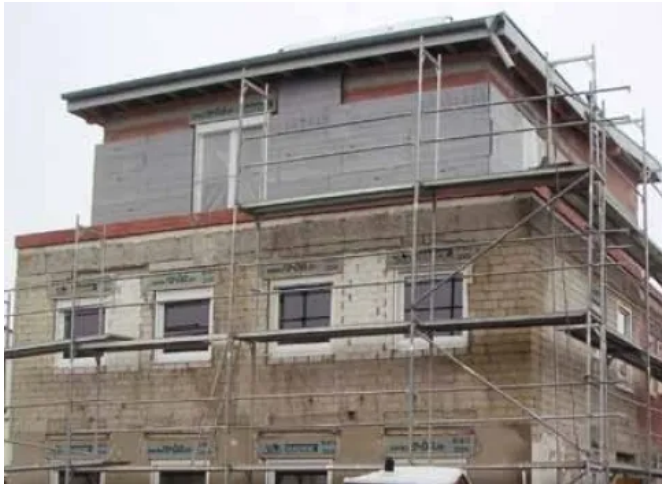
Kerndämmung mit RAVATHERM™ XPS X