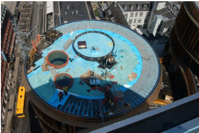
Axeltorv 2 – Multifunktionsgebäude mit Umkehrdächern in Zentrum von Kopenhagen

Um etwaige Schadensquellen und somit Undichtigkeiten von vornherein auszuschließen, wird in der umgekehrten Bauweise häufig eine bituminöse Dachabdichtung kraftschlüssig auf der Tragschicht (Betondecke) aufgebracht. Dadurch wird eine Unterlaufsicherheit der Dachabdichtung erreicht. Als Wärmedämmstoff oberhalb der Dachabdichtung kommt ausschließlich ein geschlossenzelliger Hartschaum aus extrudiertem Polystyrol (XPS) zur Anwendung. Neben der Eigenschaft resistent gegen Wasser zu sein, hat der XPS-Dämmstoff eine sehr hohe Druckfestigkeit, eine ausgezeichnete Dämmleistung und schützt die darunterliegende Abdichtung vor mechanischen und thermischen Einflüssen. Die für den Umkehrdachaufbau notwendigen Auflasten erfüllen verschiedene Funktionen. In dem hier vorgestellten Projekt übernimmt die Auflast aus Kies und Begrünung sowie verschieden gestaltete Verkehrsflächen die Sicherung des Schichtenpakets gegen Windsog.