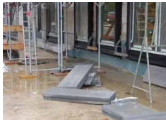
Sockeldämmung mit RAVATHERM™ XPS X