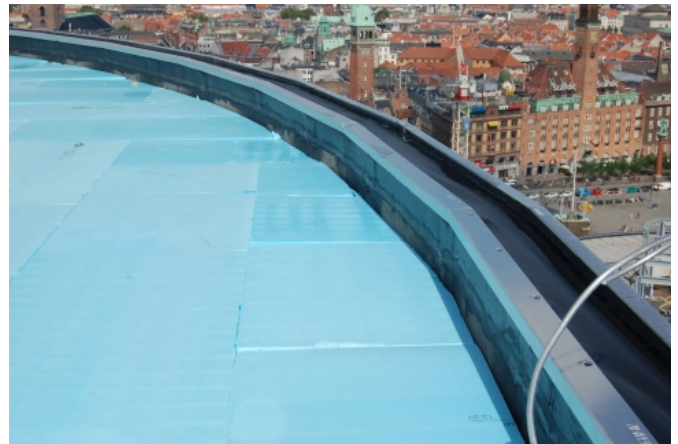
Axeltorv 2 – Multifunktionsgebäude mit Umkehrdächern in Zentrum von Kopenhagen

Für die Dachabdichtung wurde eine hochwertige 2-lagige Abdichtung aus Polymerbitumenbahnen eingesetzt. Auf diese Abdichtung wurden 3.500 m 2 XPS-Dämmplatten von RAVAGO Typ RAVATHERM™ XPS 300 SL* in 2 x 200 mm Dicke dicht gestoßen, und im Verband lagenversetzt verlegt. Das Produkt ist seit über 30 Jahren durch das Deutsche Institut für Bautechnik (DIBt) Berlin für diesen Anwendungsfall allgemein bauaufsichtlich geregelt. Die Ausführung der Dächer erforderte aufgrund der außergewöhnlichen Architektur eine besonders hohe fachliche Kompetenz des ausführenden Unternehmens Jürgen Paust GmbH aus Norderstedt.