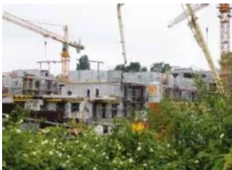
Sockeldämmung mit RAVATHERM™ XPS X