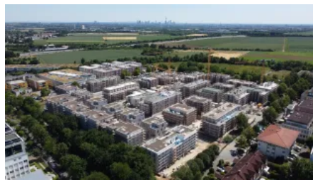
Rhein-Main-Gebiet: Quartierentwicklung mit 6.000 m 2 Dachfläche