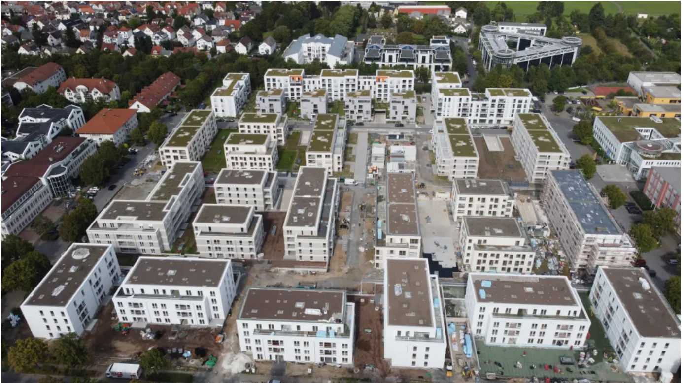
Wohnquartier „Am Südcampus“ in Bad Homburg

Aus der Serie Ravago - Wärmedämmstoffe aus XPS von Ravago Building Solutions Germany