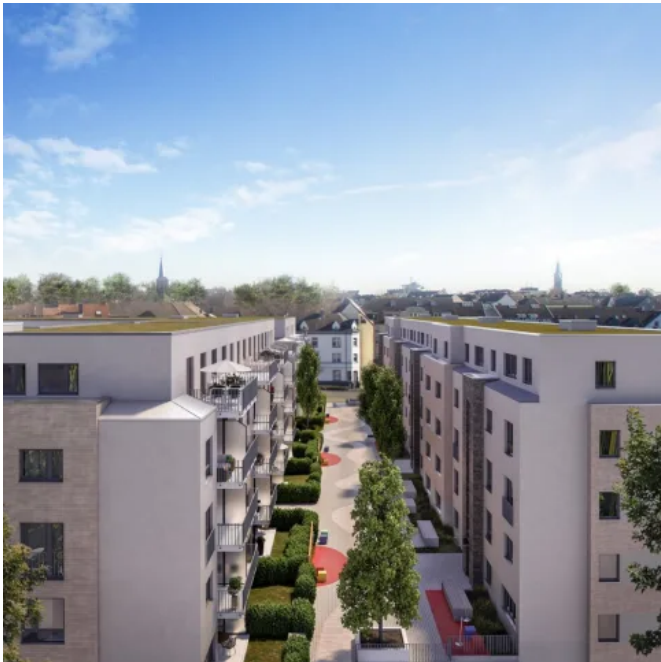
Mit den XPS-Dämmstoffen RAVATHERM™ XPS 300 SL von Ravago Building Solutions erreicht das Retentionsdach eines Solinger Wohnbauprojekts eine sehr hohe Energieeffizienz.

Im nordrhein-westfälischen Solingen bietet ein Stadtquartier insgesamt 308 1- bis 4-Zimmerwohnungen, mehrere Gewerbeflächen für Gastronomie und den Einzelhandel sowie zwei Tiefgaragen für insgesamt rund 270 Pkw.