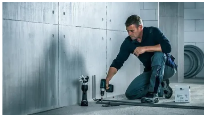
RAUTITAN für die Heizkörperanbindung

Rohr, Fitting und Schiebehülse ergeben eine dauerhaft dichte Verbindung. Und das ohne O-Ringe. Das Rohr selbst ist das Dichtmittel, die Installation ist sofort druckbelastbar.