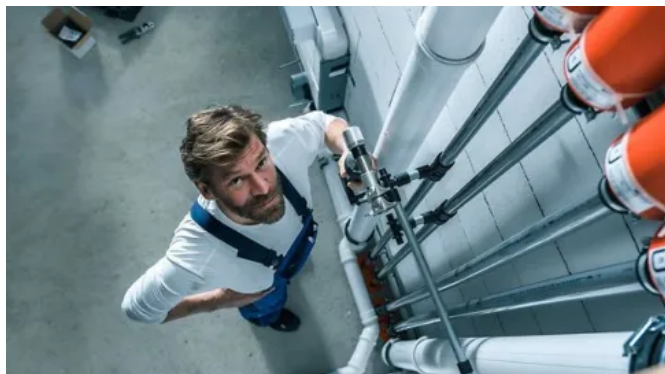
RAUTITAN für die Trinkwasserinstallation

Aus der Serie REHAU Sanitärinstallationen von REHAU Water Technologies