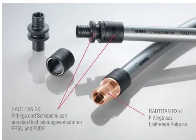
RAUTITAN: Verbindungstechnik Schiebehülse

Heizkörperanschlüsse aus dem Fußboden, der Wand oder der Sockelleiste lassen sich mit RAUTITAN einfach und sicher installieren.