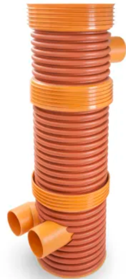
RAUSIKKO Standardschacht DN 600, Aufbau mit Unterteil, Verlängerung und Zulauf

Standardschacht aus PP mit zahlreichen Anschlussmöglichkeiten und -varianten für den einfachen Anschluss an Box-Rigolen-Systeme.