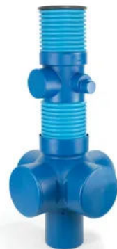
Universalschacht DN 400, Aufbau mit Verlängerung und Zulauf

Standardschacht aus PE als Multifunktionsschacht für die Anwendung in Rohr-Rigolen-Systemen mit bis zu 4 Anschlüssen RAUSIKKO DN 350.