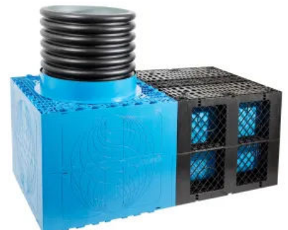
RAUSIKKO C3 Typ X Systemschacht

Das modulare Schachtsystem aus PP mit integrierter Schneidmatrix ermöglicht den Anschluss in alle vier horizontalen Raumrichtungen zu RAUSIKKO Boxen, Anschlussstutzen, KG Rohren oder RAUSIKKO Rohrrigolen.