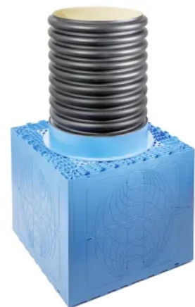
RAUSIKKO Schacht C3 Typ X Systemschacht