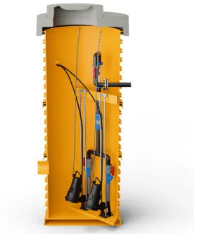
RAUSIKKO Pumpenschacht mit konstantem Ablauf

Komplette Ausstattung mit hochwertigen Abwasserpumpen, korrosionsbeständigen Armaturen und Rohrleitungen.