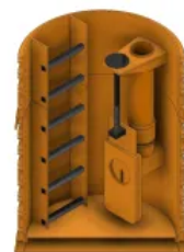
RAUSIKKO Schacht DN 800 und DN 1000, Ausführung als Drosselschacht mit Gewindedrossel

Ausführung objektspezifisch konfektioniert mit Einbauelementen für Drosselung, Rückstausicherung, Leichtflüssigkeitsrückhalt oder Anstausystem