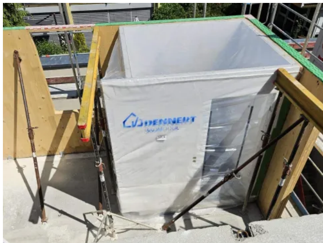
Vorgefertigte Badmodule für serielle Bauvorhaben