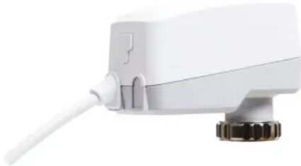
TA-Slider 160: Digital konfigurierbarer stetiger Push-Stellantrieb

Aus der Serie IMI HEIMEIER: Thermostatische Regelung von IMI Hydronic Engineering Deutschland