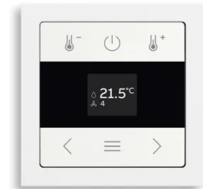
Raumtemperaturregler mit Display, wireless

Aus der Serie Raumtemperaturregler von ABB Busch-Jaeger