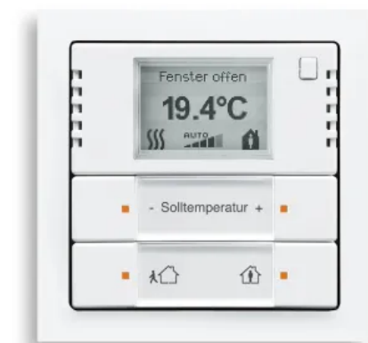
KNX-Raumtemperaturregler mit Tastsensor