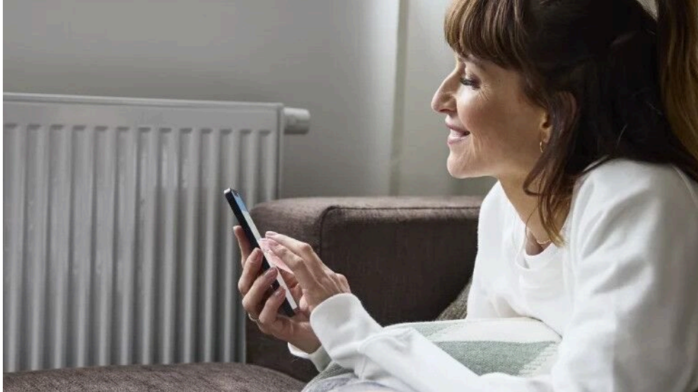
ABB AG Busch-Jaeger Freisenbergstr. 2 58513 Lüdenscheid Deutschland