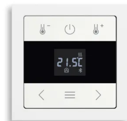
Raumtemperaturregler mit Display BT