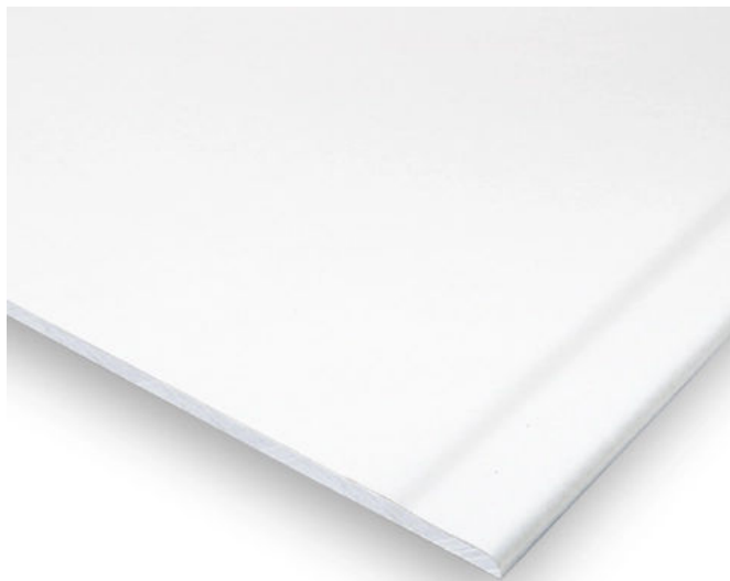
Clima Top Activ'Air