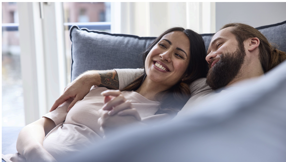
ABB AG Busch-Jaeger Freisenbergstr. 2 58513 Lüdenscheid Deutschland