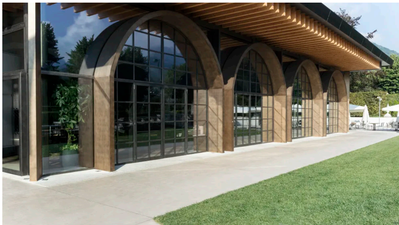
La birreria Pedavena