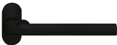
Rahmentürbeschlag Rhodos gekröpft, mit Ovalrosetten, ohne Schloss, Farbe Kosmos Schwarz | © Karcher Design