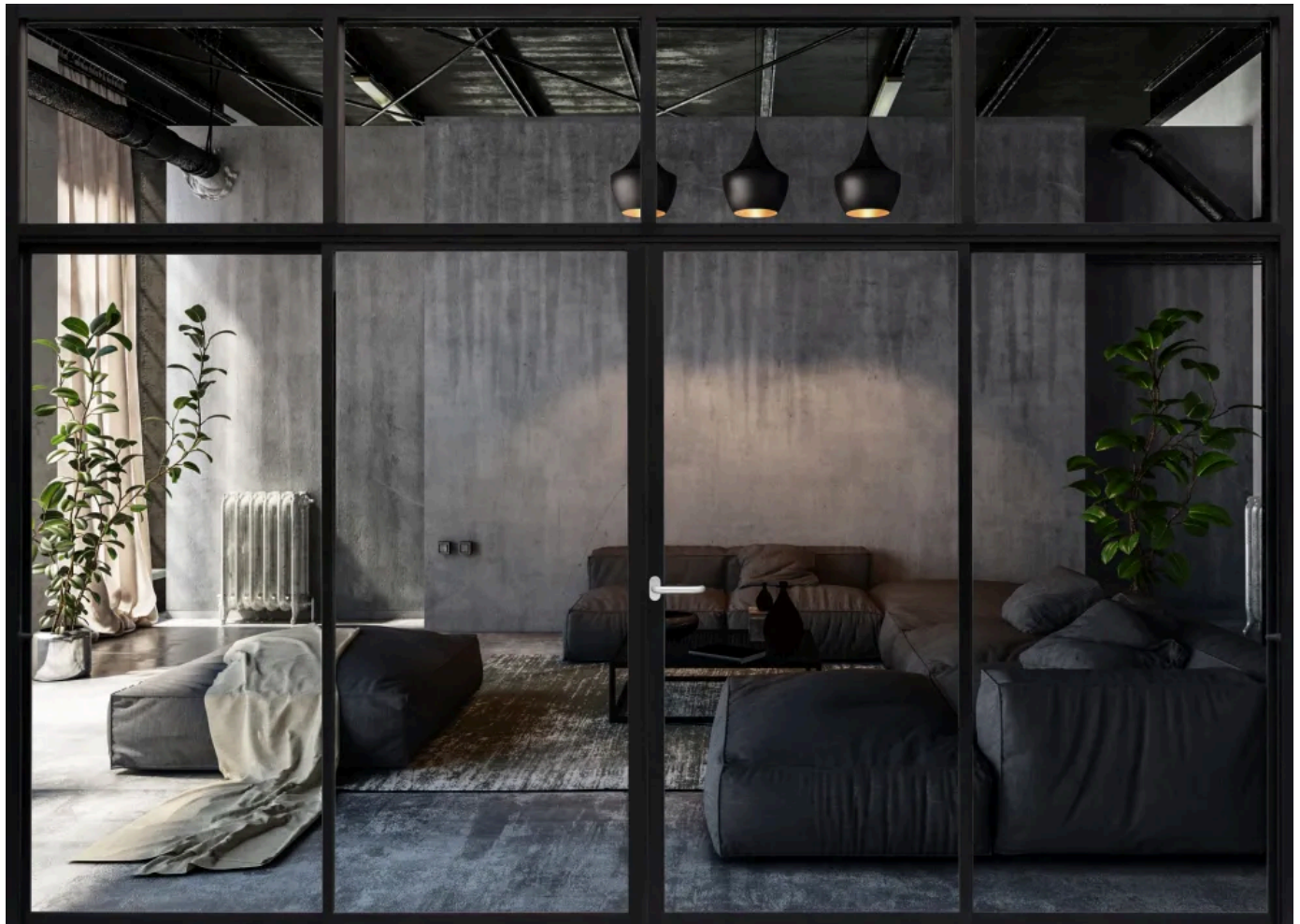
Rahmentürbeschlag Kreta mit Ovalrosette, ohne Schloss Edelstahl

Aus der Serie Beschläge und Türgriffe für Innentüren und Eingangstüren von Karcher Design Beschläge