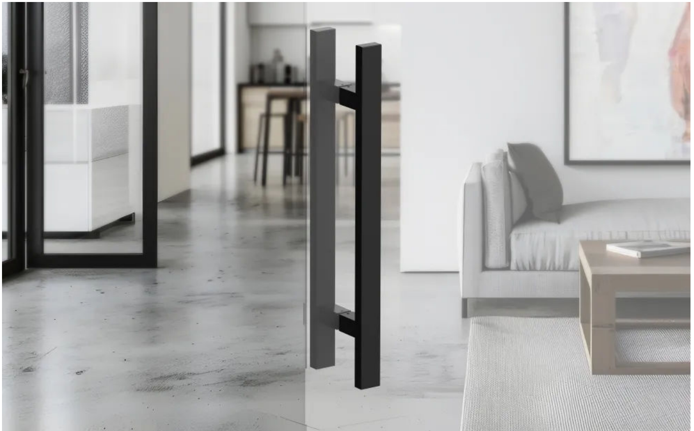
Stoßgriff ES6Q Farbe Kosmos Schwarz

Aus der Serie Beschläge und Türgriffe für Innentüren und Eingangstüren von Karcher Design Beschläge