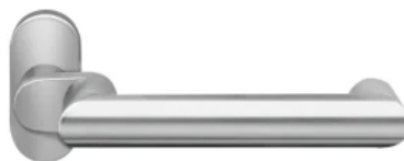
Rahmentürbeschlag Kos gekröpft, mit Ovalrosette, ohne Schloss, Edelstahl