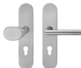
Schutzbeschlag I mit ovalem Türschild beidseitig, Edelstahl | © Karcher Design