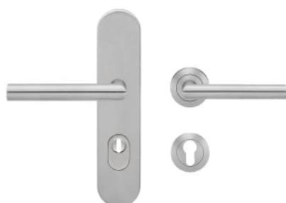
Schutzbeschlag mit ovalem Türschild außen, innen Rosetten, Edelstahl