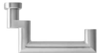
Rahmentürbeschlag Kos Aufsicht