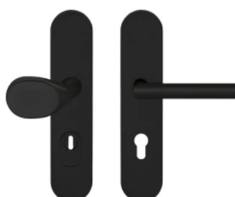
Schutzbeschlag I mit ovalem Türschild beidseitig, Farbe Kosmos Schwarz