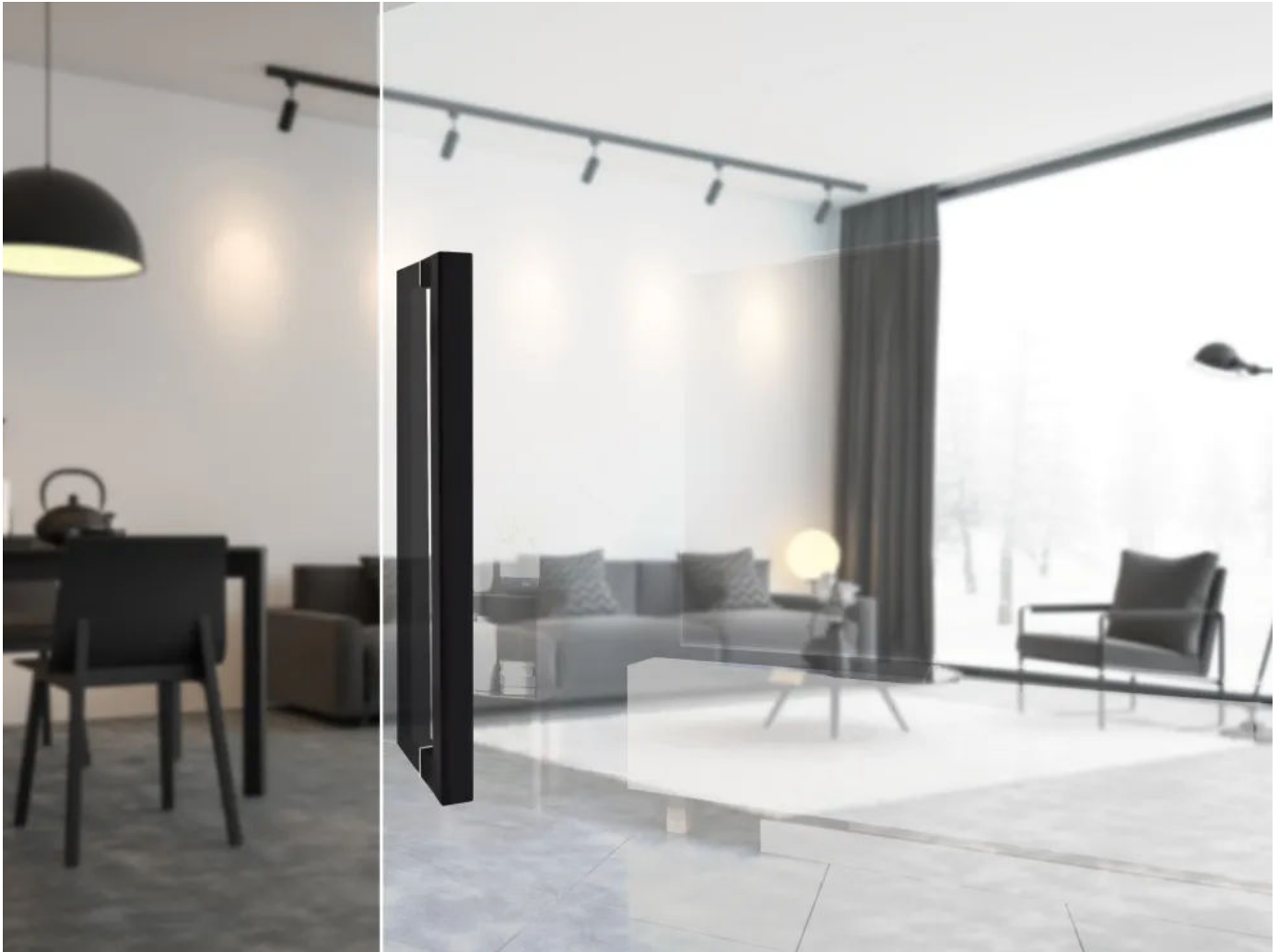
Stoßgriff ES46Q Farbe Kosmos Schwarz | © Karcher Design (© 3darcstudio - Fotolia)

Aus der Serie Beschläge und Türgriffe für Innentüren und Eingangstüren von Karcher Design Beschläge