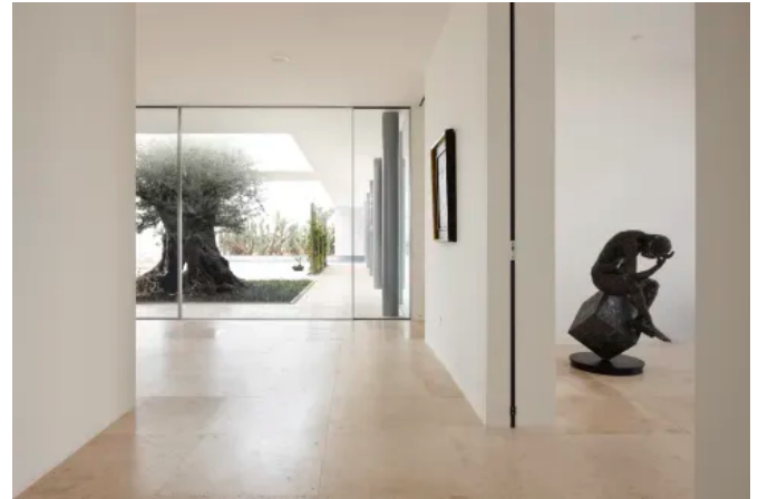
Höchster Objektschutz für Museen, Juweliere, Botschaften

Je höher die Widerstandsklasse, desto schwieriger der Einbruch. Während Standardfenster mit der Widerstandsklasse RC1 einen geringen Einbruchschutz aufweisen und daher von Einbrechern in relativ kurzer Zeit überwunden werden können, wird bei der hohen Widerstandsklassen RC4 bedeutend mehr Zeit und weiteres Spezialwerkzeug benötigt.