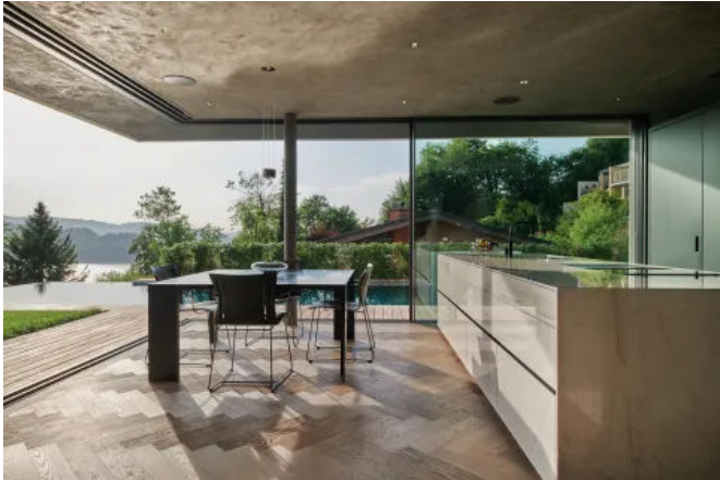
99% Aussicht – 100% Sicherheit

Aus der Serie Das rahmenlose Schiebefenstersystem von swissFineLine